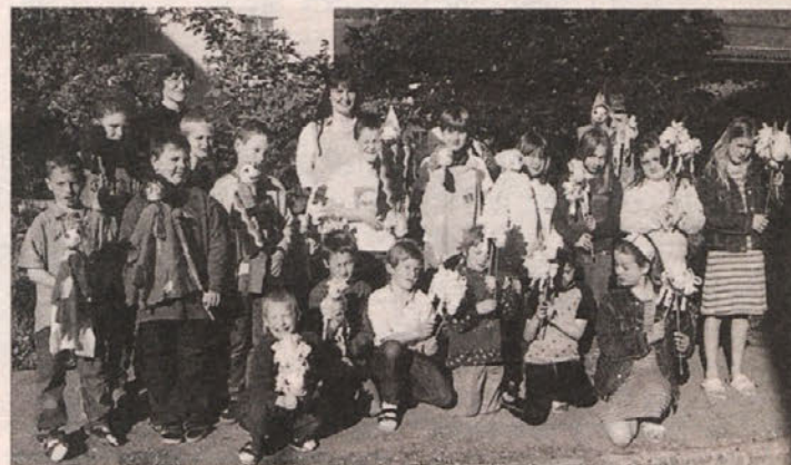
Otroci so se silno potrudili in ustvarili nekaj pravcati umetnin.