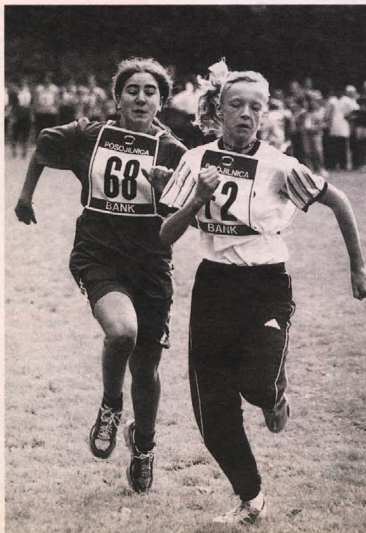
Jeseni bodo v okviru 3. Super-trim-tekmovalja južnokoroških krajev spet na sporedu napeta tekmovalja v lahki atletiki ... in tudi drugih panogah, kot npr. pri žaganju debela.