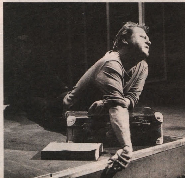
Prizor iz predstave Klovnovi pogledi

Iz aplavza, ki se je spontano usul kakor suha toča v to mrtvaško tišino, je zvenela globoka hvaležnost režiserju in ansamblu. Škoda, da so stopili samo štirikrat na celovški oder! Vse mestne srednje šole bi morale z vsemi generacijami vred videti tega Böllovega Klovna. J. M.