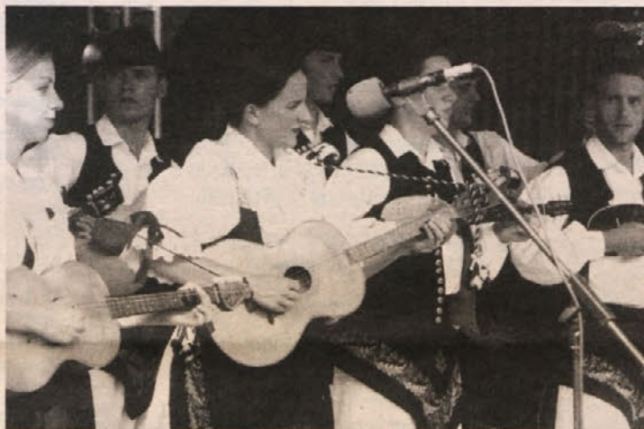
Hajdinjaki so prinesli pozdrave gradiščanskih Hrvatov