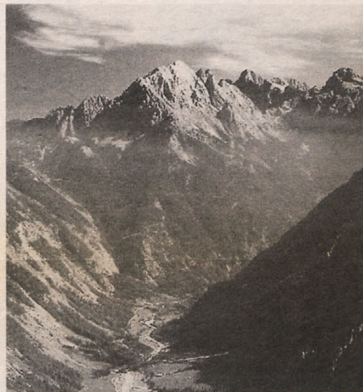
Zadnja Trenta z Bavškega Grintavca

Torej peš v hribe nas navdušuje avtor knjige in meni, da »staromodna« hoja v današnjih časih, ko naj bi bili v prostem času čim bolj dejavni, zelo priljubljena in zdrava, še posebno v gorah. To je pred kratkim potrdila tudi znanstvena raziskava (AMAS 2000) češ, da hoja med 1400 in 2000 m deluje proti visokemu krvnemu tla-