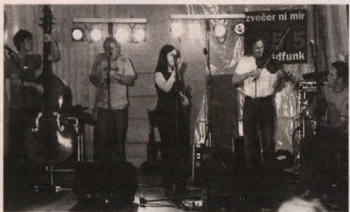
Skupina Grada je igrala irsko-keltske akorde