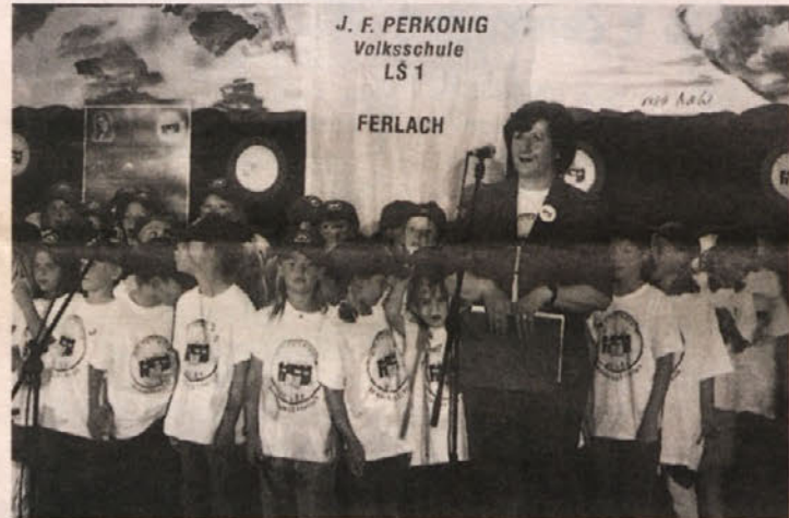
Ravnateljica LŠ 1 z otroki na predstavitvi