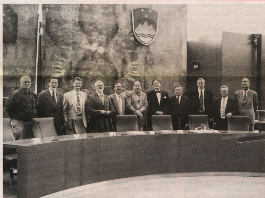
Predstavnike koroskih Slovencev je v Ljubljani sprejel državni zbor, tam pa so lahko podali svoje gledanje na meddržavne odnose in na položaj manjšin. Glej uvodni članek.