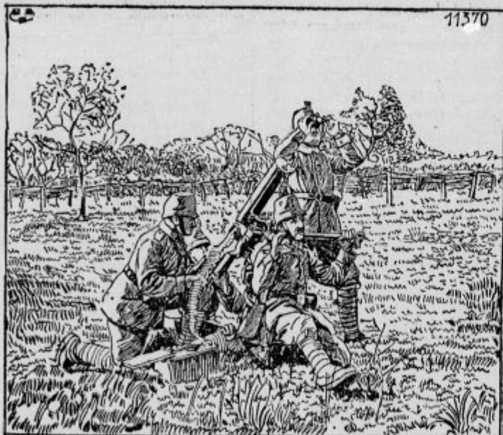
Obstreljevanje sovražnikovih letalcev.

Pozdravi. Sprejmite srčne slovenske pozdrave vsi čitatelji »Domoljuba« in tovariši-znanci na fronti in doma. Vrnil sem