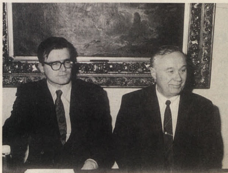
Slovenski zunanji minister Zoran Thaler in generalni konzul v Celovcu Jože Jeraj

Na neuradnem enodnevnem obisku se je v ponedeljek, 20. novembra na Koroškem mudil slovenski zunanji minister. V pogovorih s predstavniki manjšine in deželne vlade so bili v ospredju predvsem stiki med obema deželama in seveda manjšinsko vprašanje. Thaler je obisk na Koroškem ocenil kot