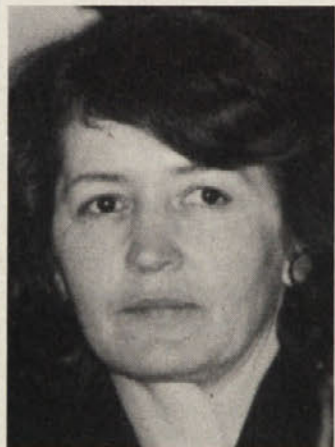
Piše Sonja Wakounig

ga Mračnikar pa svojo kulturalnost in tudi finančno spretnost vsakodnevno dokazuje kot direktorica založbe »Drava«. Tudi v upravnem odboru srečamo vrsto aktivnih in osveženih žena oz. deklet.