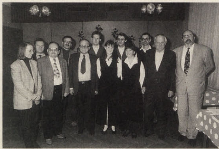
Odborniki in gostje ob občnem zboru kluba