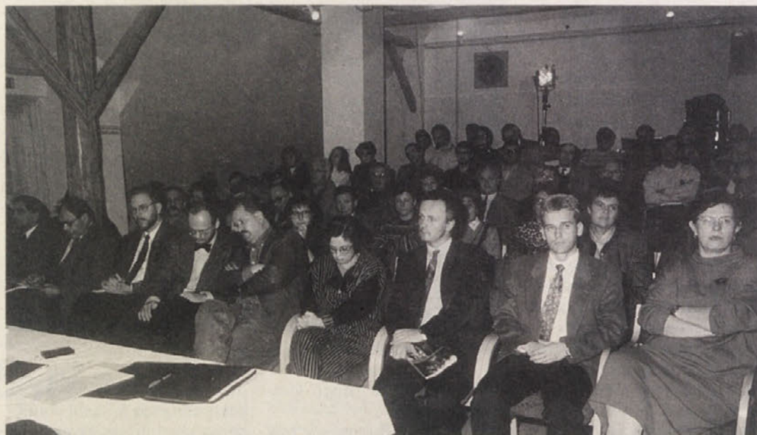
Delegati in gostje na občnem zboru