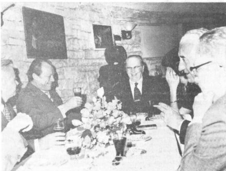
Kancler Zvezne republike Nemčije Willy Brandt se je med obiskom v naši državi na Brionih pogovarjal tudi s predsednikom Titom. Med pogovori, ki so potekali v zelo pristrčnem in odprtem ozračju, sta državnik preučila vrsto vprašanih o dvostranskih odnosih in o možnostih za poglabitev teh odnosov med državama. V uradnem komuniciraju je izraženo obojestransko zadovoljstvo z doseženimi rezultati, postavili pa so tudi temelje še za uspešnejše razvijanje teh odnosov. NA SLIKI: Predsednik Tito je svojega gosta popeljal na ogled otoka Vanga, kjer sta v kleti poskusila vino iz vinograda na otoku.

Pred odhodom kanclerja Brandta z Brionov je predsednik republike Josip Broz Tito povabil voditelja ZRN dr. Gustava Heinemann, naj obišče Jugoslavijo.