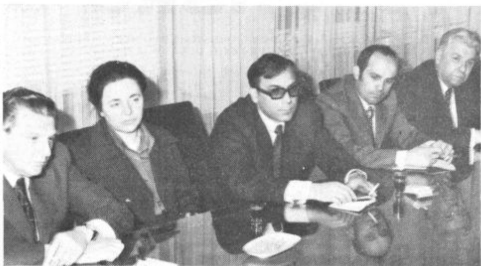
Bolgarska delegacija, ki je bila na povabilo predsedstva ZKJ v naši državi, je obiskala tudi Velenje.