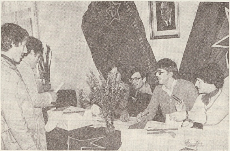
Na referendumu TOZD Pekarne Ljubljana