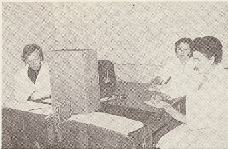
Z referendumom v Pekatetah

»Na kaj lahko vpliva tehnik v kontroli kvalitete?« »Opozorim lahko na to, da manjka dodatek v bonbonih (kislina), v času ko še teče postopek, še preden pride do serijske proizvodnje...« pomisli, in pogovor steče bolj sproščeno. »Vlage ne moremo takoj določiti, postopek dlje traja. Pomembno je polnilo, pa kvaliteta bonbonskega obliva (pri čokoladnih desertih). Na moje opozorilo lahko napako ne mudoma popravijo. Ta naš novi stroj ima vse avtomatsko urejeno, tako tudi dodajanje določene sestavine. Pritisneš na gumb, določen procent sestavine se nadočne pomeša z drugimi primesmi, in napaka se izravna... Prav tako lahko neko sestavino odvzamemo, zmanjšujemo njeno količino.«