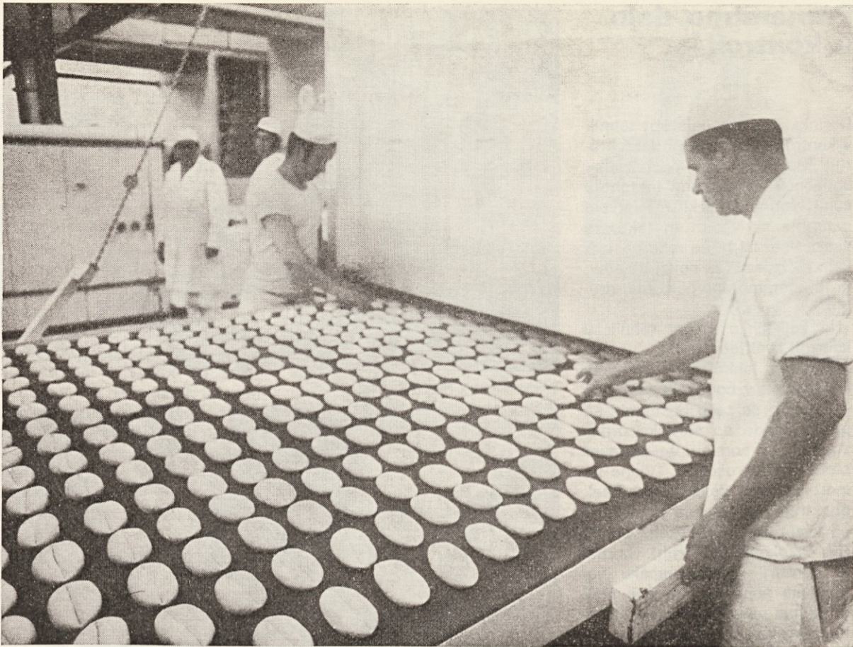
Znanje je naš vsakdanji kruh