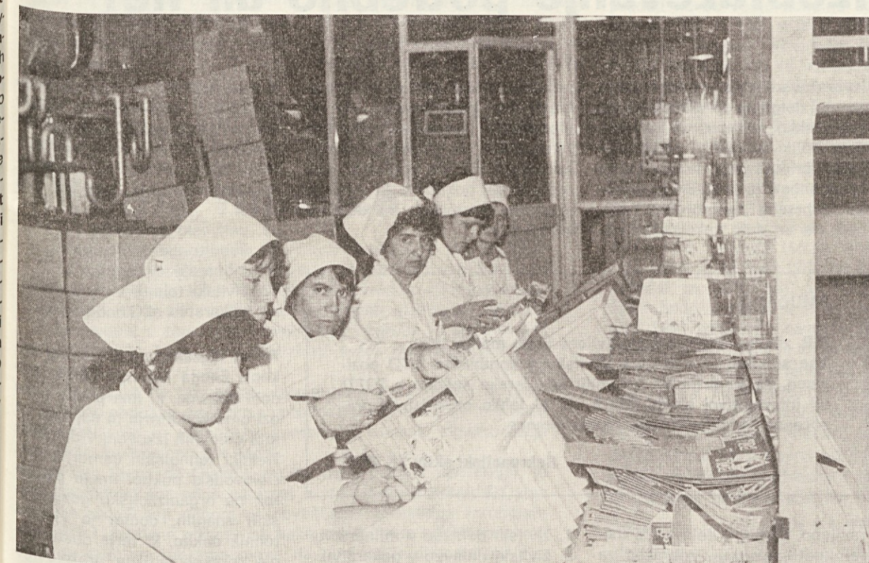
Delavke Šumija pri pakirnem stroju