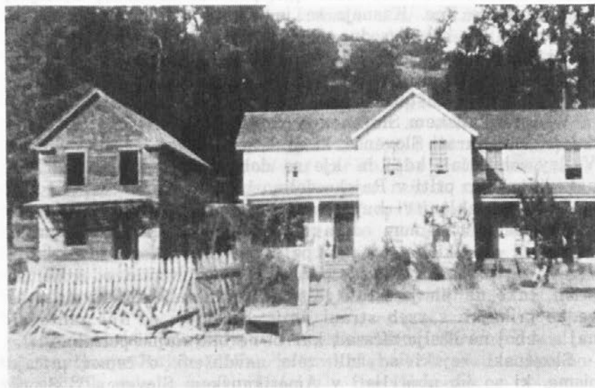
Hišo na levi so si postavili slovenski naseljenci v času, ko so živeli v Rajski dolini

Največ ljudi (dvesto oseb) je prišlo v Rajsko dolino marca 1896. Jeram sam jih je šel iskat v Chicago in jih čez San Francisco pripeljal v Eden Valley. Posamezniki so prihajali še za njimi, veliko pa jih je že takrat zapustilo naselbino. Tako je bilo v začetku maja v Rajski dolini okrog dvesto slovenskih naseljencev. 22