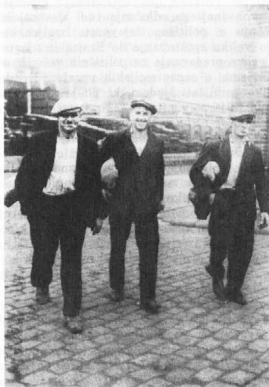
Slovenski delavci v Lensu, 1937

Omenili smo, da si je partija prizadevala za odločujoč vpliv v vseh ljudskofrontnih organizacijah, tako tudi sindikalnih. Po združitvi socialističnega in komunističnega sindikata v enoten C.G.T. (marca 1936) je naraslo zanimanje za vključevanje vanj tudi pri jugoslovanskih priseljencih. Privlačnost včlanjenja so spodbujali uspehi, kot so: 40-urni delavnik, plačan dopust, prenehanje šikaniranja rudarjev po jamah, povišanje plač ipd. 32