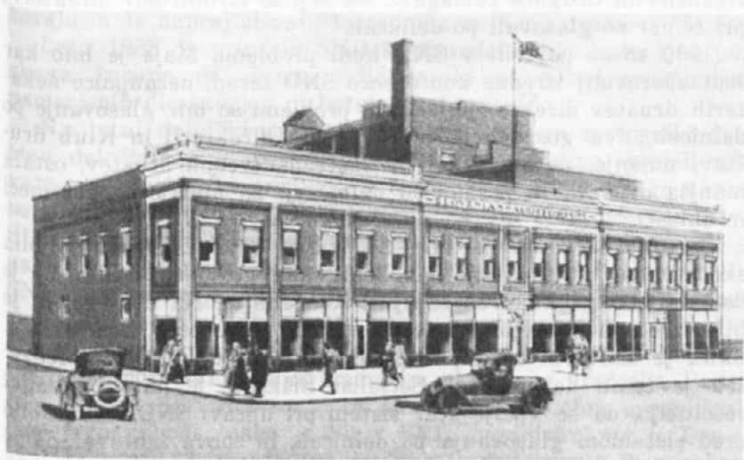
Slovenski narodni dom (50-th Anniversary 1924-1974)

Tako je bil npr. 26. novembra 1925 v SND slovesen dan v počastitev prihoda hrvaškega umetnika Ivana Meštrovića. Ob tej priložnosti so organizirali koncert slovenskih, hrvaških in srbskih zborov. 67