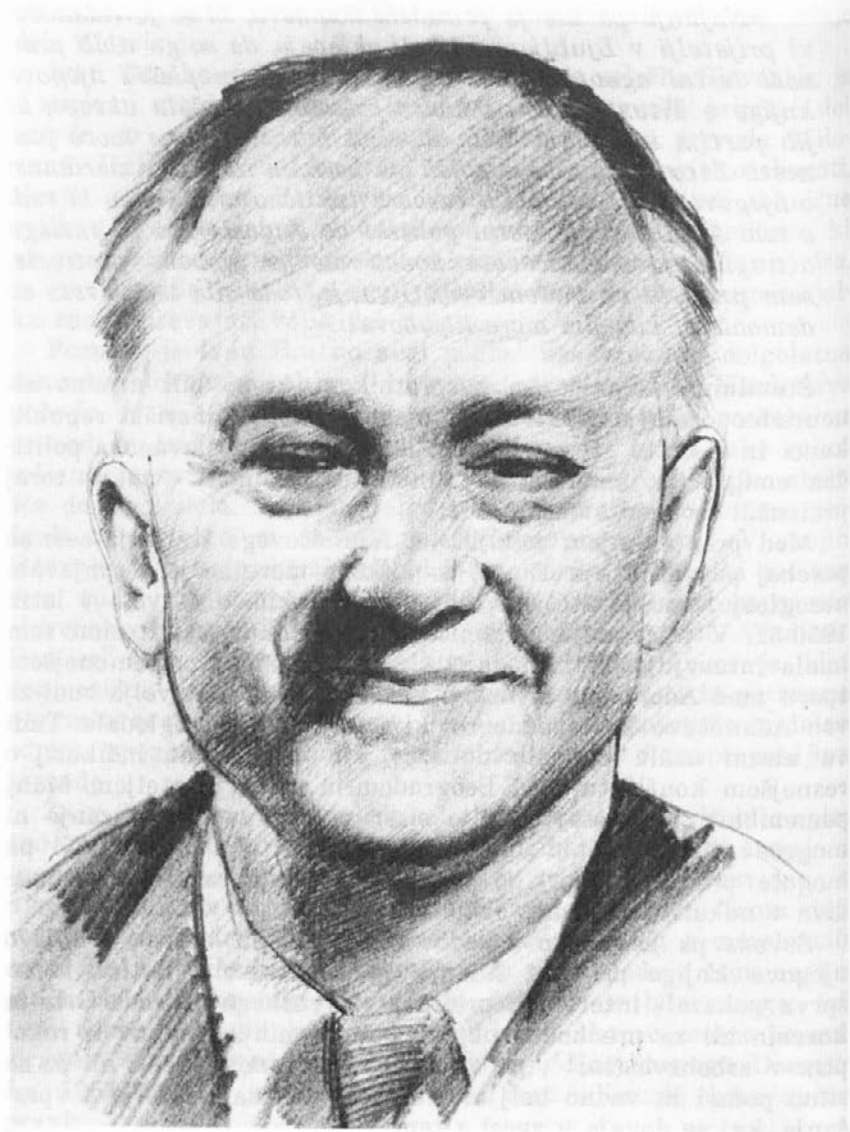
Louis Adamič, risba neznanega avtorja