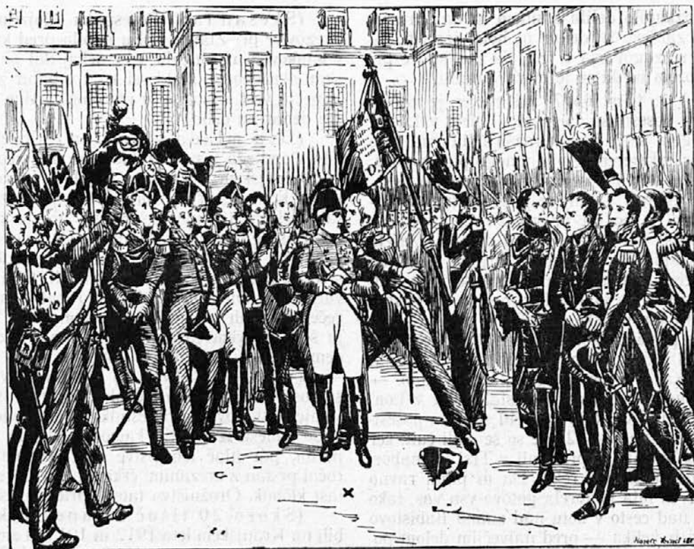
Napoleon se poslovil v mestu Fontainebleau.