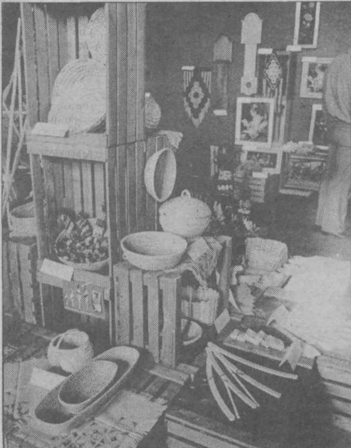
Prizor z razstave

Končno smo le dočakali začetek gradnje nove Zaloške ceste, ki bo odpravila vrsto poredkih prometnih zagat na vsako leto bolj problematičnem odseku med Mostami in Studencem.