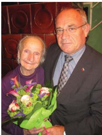
Boštaj Frančiška Vrhpolje