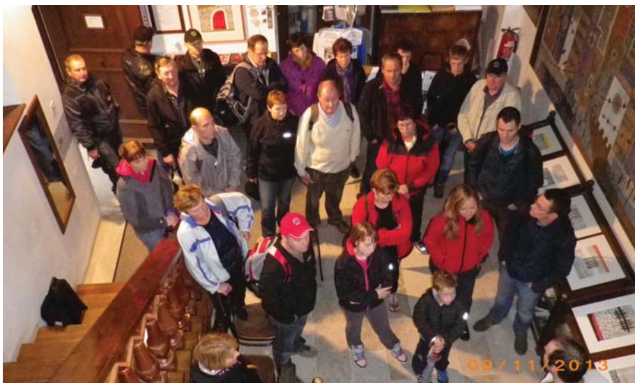
Javorščani pozorno poslušajo razlago vodiča