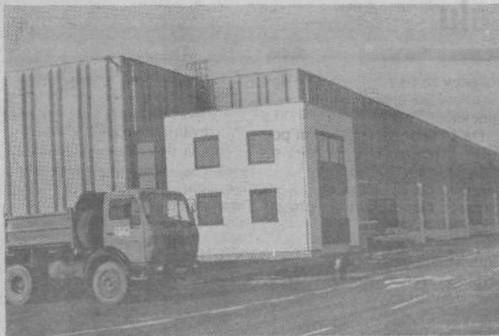
Prvi od objektov, ki ga je BTC zgradil na prostoru, namenjenem prosti carinski coni. K skladiščni zgradbi je pritisnjena tudi manjša poslovna stavba

»Število interesentov za prosto carinsko cono kaže tudi na to, da imamo v Jugoslaviji o tem zgrešene predstave,« pravijo v BTC. Nekateri mislijo, da bi se na ta način mogli rešiti razni problemi, predvsem tisti z uvozom, ob tem pa pozabljajo na ekonomske razloge. Osnovni namen take carinske cone je modernizacija naše proizvodnje in izdelava takih proizvodov, ki bi bili dovolj