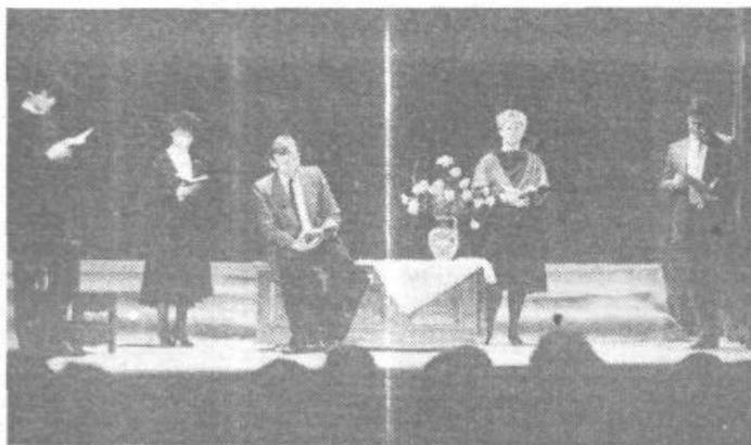
Tako naš in nam bližu je bil kulturni večer na Barju