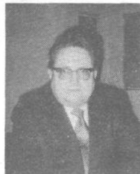
Dr. Avgust Belič

»TIPRO je kot delovna organizacija v ustanavljanju pričela z delom v najetih prostorih na novi lokaciji 1. 1. 1986. leta. Mi smo dali 16 specializiranih kadrov, vključno s strokovnim vodjem in bivšim pomočnikom direktorja IEVT, ter vso potrebno opremo in znanje. Del sredstev bo TIPRO vrnila v naslednjih letih. Dajala bo tudi sredstva za intenziven razvoj na področju tipk in tipkovnic v IEVT. Ker sedaj dela v najetih prostorih, bo skušala v naslednjih letih zgraditi svoj objekt. Zanimivo pa je, da se je že med poskusno proizvodnjo tipk na IEVT pokazala nujnost razvoja tipkovnice.«