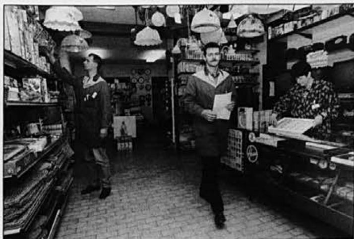
Del raznovrstne ponudbe v prodajalni Železnina

V letošnjem letu praznuje žirovska zadruga visok jubilej