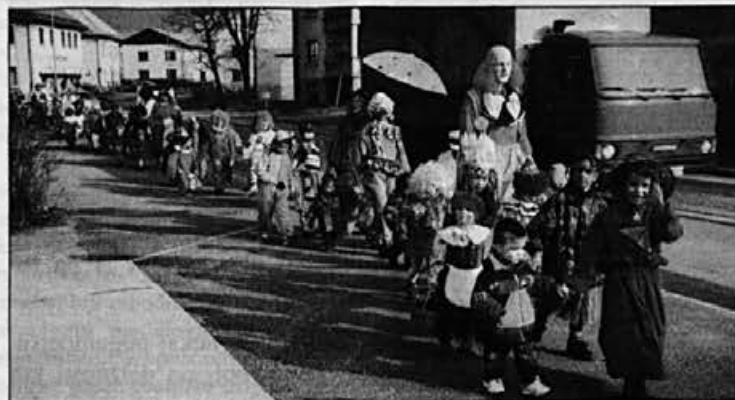
Sprevod najmlajših, med katerimi je bila konkurenca, katera je najlepša, najbolj domiselna – največja