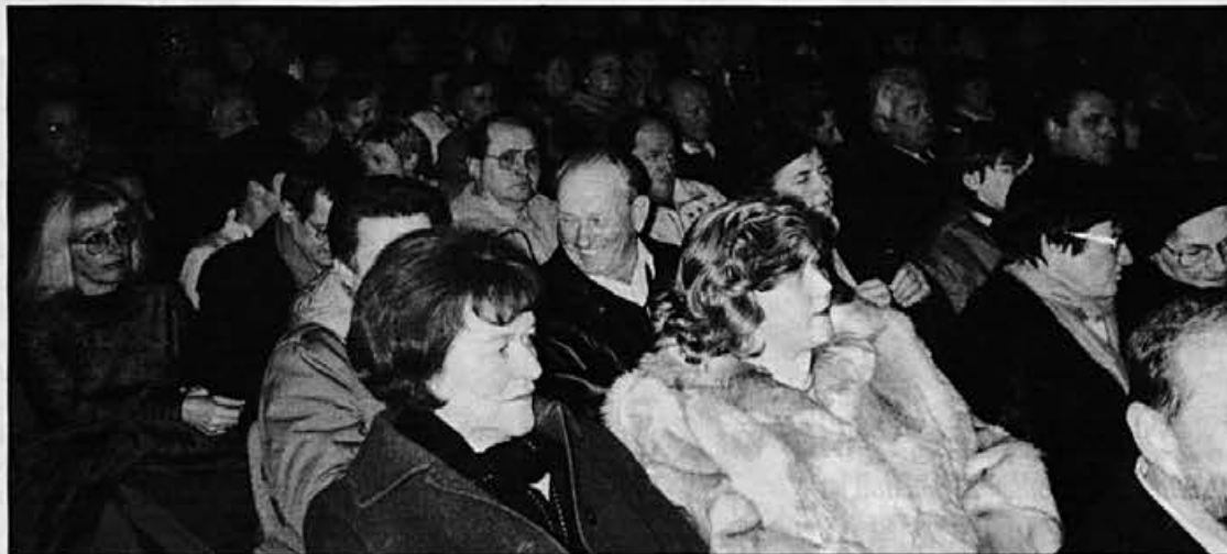
Ob dokumentarnem filmu o začetku Alpine smo z veseljem obujali spomine