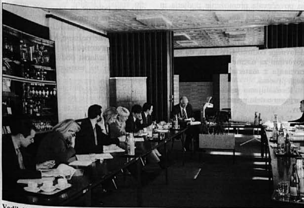
Vodilni delavci, predstavniki EBRD in Phare so se seznanili z našimi možnostmi razvoja