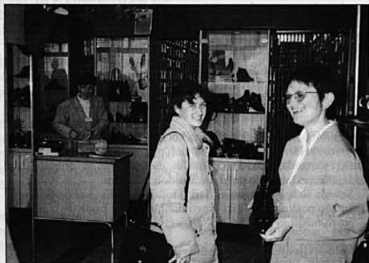
V prodajalni modne obutve v blagovnici je februarja in marca slab obisk