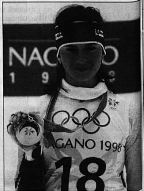
Ekaterina Dafovska, olimpijska zmagovalka v biatlonu na 15 km, tekmuje z Alpininimi čevlji