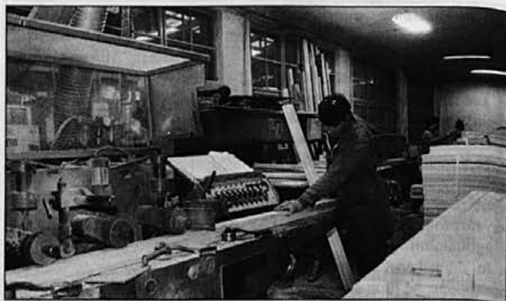
Finalna predelava lesa poteka v enoti Mizarstvo