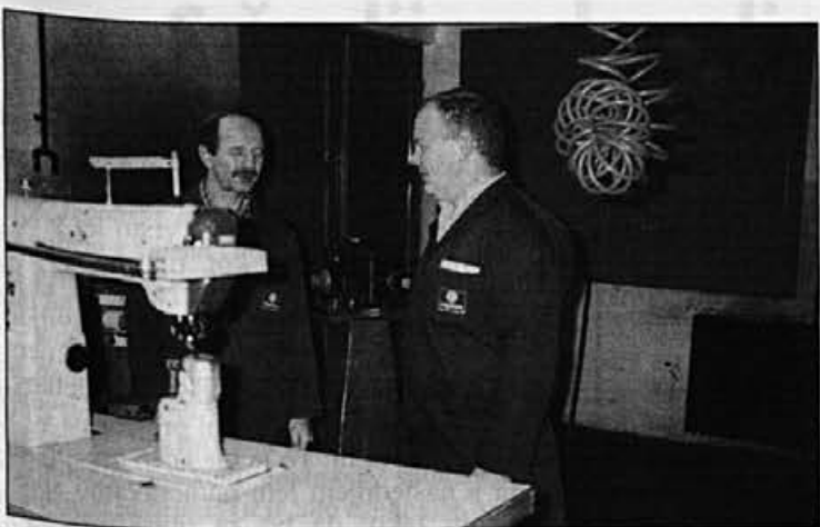
Kaj bo trebna urediti danes?