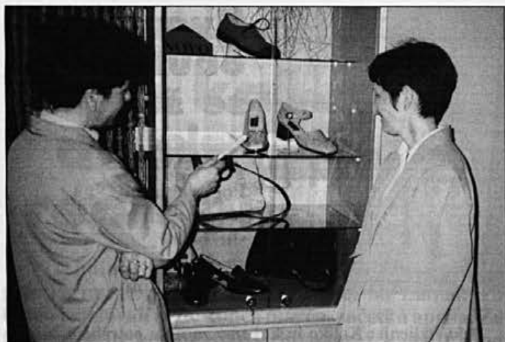
Lepo urejena vitrina modne obutve