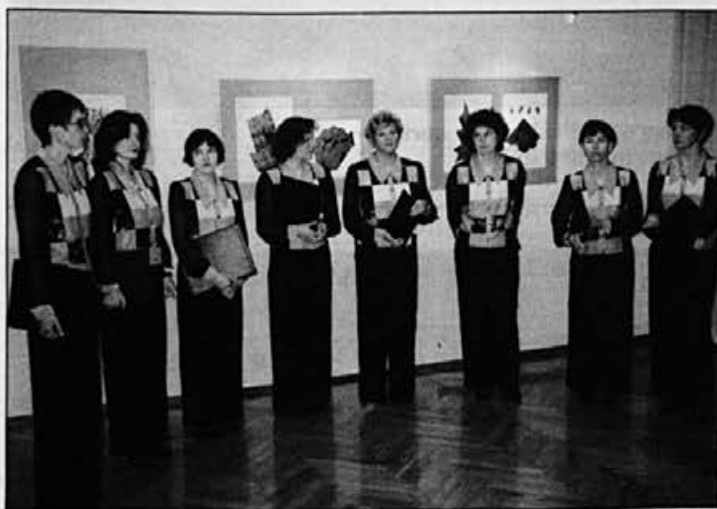
Zapele so Kresnice