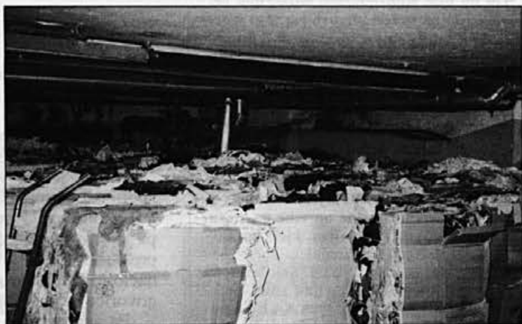
Tudi smeti in odpadki morajo biti primerno urejeni