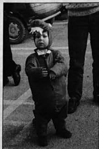
Takega dinosavra se je pa res treba bati

Nadaljevalo se je popoldne na pustni torek, ko so se maskare, predvsem cicibani in