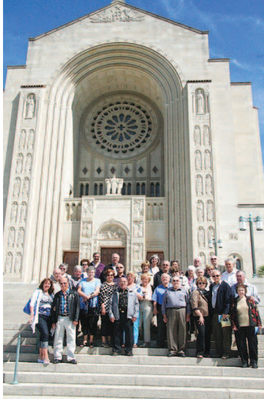
Pred katedralo v Washingtonu, D.C.

Najbolj zanimiv dan pa je bil, ko smo se obiskali Baziliko »Narodno Svetišče Brezmadežnega Spočetja«. Ta cerkev je osma največja na svetu. Sprejme okrog 11.000 vernikov. Bazilika ima več kot 70 kapelic, posvečenih vsem narodnostim. Vodič fran-čiškanskega reda nam je rad ustregel, da nismo šli mimo slovenske kapele, ki je posvečena brez-