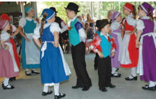
Plesna skupina Marjetice