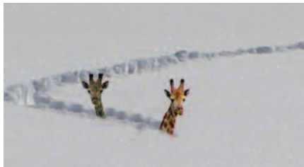
Vremenska napoved naslednje zime

Prodajalka to nekaj časa gleda, potem pa reče: "Čudno, gospod, zadnjič ko ste bili z drugo damo, niste zganjali takega cirkusa zaradi cene."