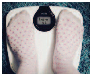
Je teža zadovoljljiva?