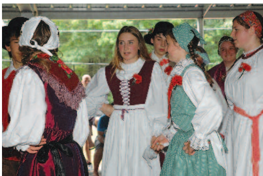
Plesna skupina Nagelj v Montrealu