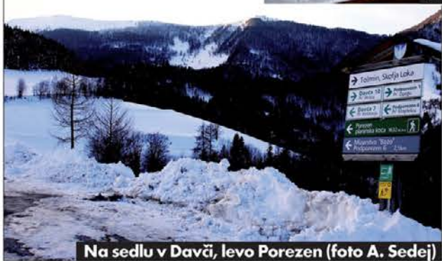
Na sedlu v Davči, levo Porezen

množično obiskan Terčeljev shod v Logu pri Vipavi, ki ga je pripravil Terčeljev odbor Vipavske dekanije, 15. 12.2010 je bil posnet na območju Davče video zapis Skoki čas-Pоследnja pot , posvečen