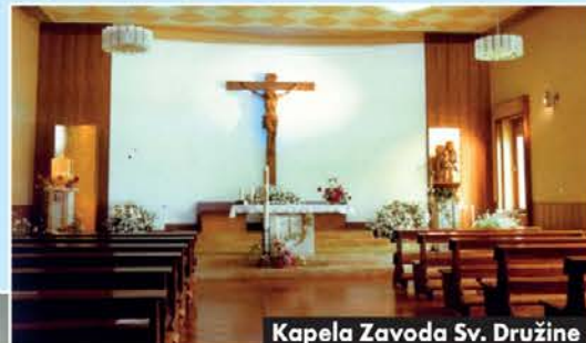
Kapela Zavoda Sv. Družine