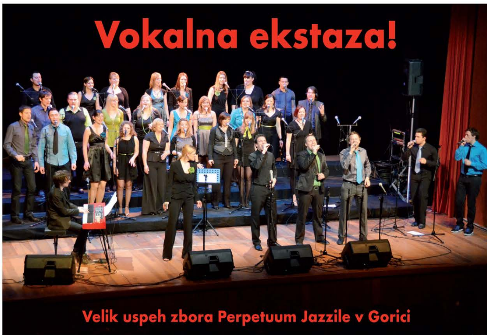
Velik uspeh zbora Perpetuum Jazzile v Gorici