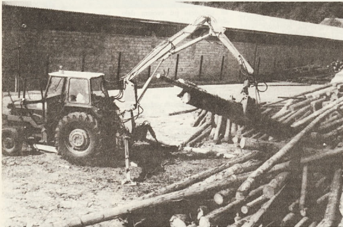
Stroj — tesalnica. Prebiranje oblega lesa s hidravličnim nakladalnikom Riko RN-3.