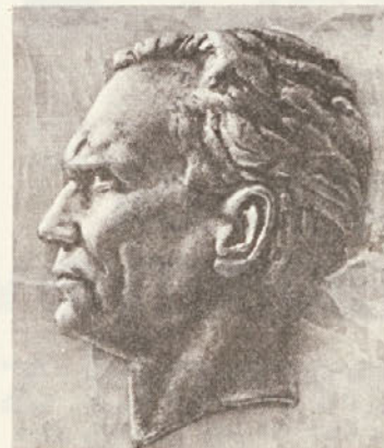
Antun Augustinčič: MARŠAL TITO

Več o naših zaslužnih delavcih berite v današnji številki DOLENJSKEGA GOZDARJA.