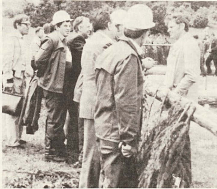
Brez sodnikov ni tekmovanja. Med publiko in njimi je vedno opazna pregrada. Pa vendar se najde čas za prijeten pomenek. (Foto: J. Falkner).

govorov je nuja. Tisti, ki jih kršijo, morajo občutiti posledice. Proti njim moramo uporabiti tudi sankcije, vstevši zamenjavo. To velja odkrito povedati...". Tako odločno zahteva tovariš Tito.