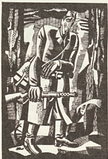
Ive Šubic: KURIR (linorez, 1975)