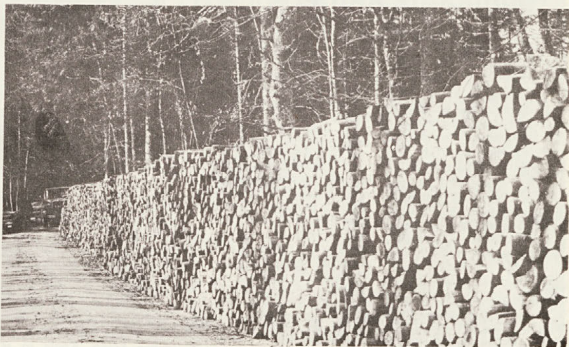
Drva postajajo ob pomanjkanju drugih virov energije vse pomembnejša surovina. Pa vendar jih je za kurjavo kar škoda, ko jih vendar tako nujno potrebuje celulozna industrija.

– V septembru je bil na pobudo SIS za gozdarstvo sestanek predstavnikov Novolesa, IMV, Pionirja, GG ter gozdarške zbornice. Na sestanku so se pogovarjali o razdelitvi jelove hlodovine. Dogovorili so se, da naj bo zbornica mesta za usklajevanje planov in programov delovnih organizacij, kamor sodi tudi uskladitev interesov do izkoriščanja lesne mase, ki je na razpolago na tem področju. Dogovorili so se tudi, da naj delovne organizacije izvažajo le končne izdelke.