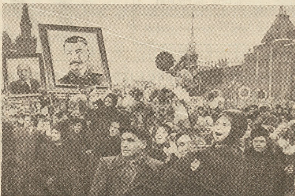
«Oktobrska revolucija ni le revolucija v nacionalnem okviru. To je predvsem revolucija mednarodnega, svetovnega pomena, zakaj ta revolucija pomeni temeljit preokret v svetovni zgodovini človeštva od starega, kapitalističnega sveta k novemu, socialističnemu svetu. Oktobrska revolucija si ni zastavila za cilj zamenjavo ene oblike izkoriščanja z drugo, marveč je bil njen namen uničiti vsakršno izkoriščanje človeka po človeku ter organizirati novo brezrazredno socialistično družbo.» (Iz govora Stalina ob desetletnici Oktobra) Gornja slika je bila posneta na letošnji proslavi na Rdečem trgu v Moskvi.