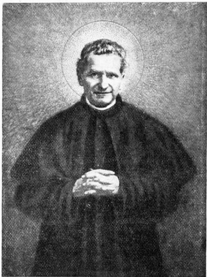
Sveti Bosko — apostol mladine.

nato oživi. Svoje čarovnije pa pospremi s šaljivo besedo, da se stara mati solzi od smeha.