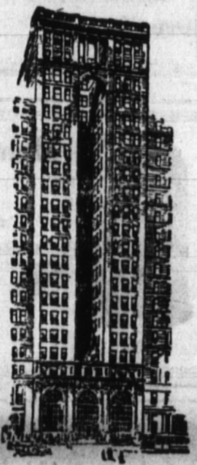
Glavna pisarna: American Express Company 65 Broadway, New York