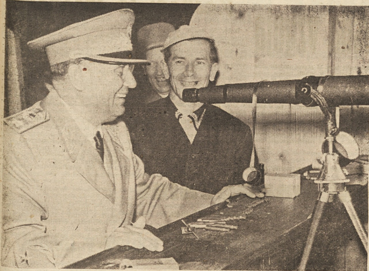
Finalna nogometna tekma za pokal FLRJ