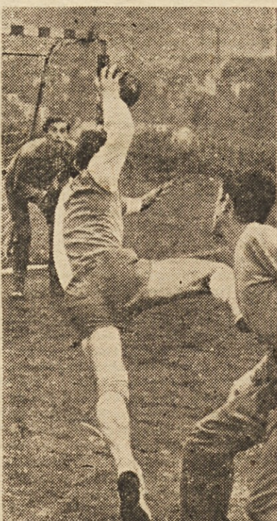
Takšnih napetih prizorov ni manj- kalo, zlasti ne pri rokometu, kot vidite na sliki

Celje, 24. maja. Nad 1500 gledalcev je danes ob lepem sončnem vremenu pri-