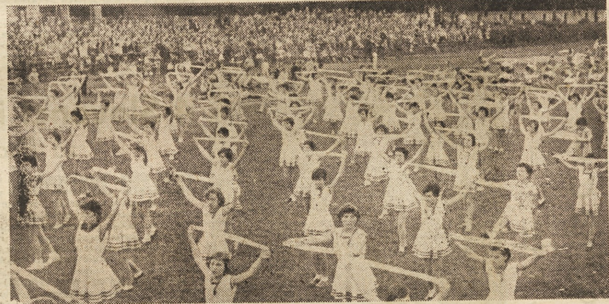
Zelo ljubeč je bil nastop pionirk s trakovi, ki je razgibal na četstkovni prireditvi veliko množico gledalcev

Ta prireditev je pokazala, da bi morali naši vaješki mladini nuditi še več možnosti za udejstvovanje v športu. S tem bi ji močno koristili pri krepitvi zdravja, razen tega pa takšna tekmovalja vplivajo na mladino in jo navajajo k dobremu medsebojnemu tovarištvu.