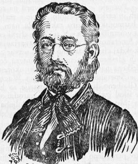
B.Smetana dle rytiny B.Kriehubera 1868.