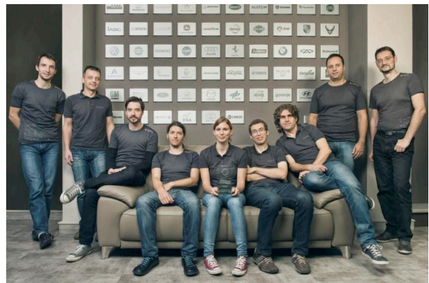
Ekipa za razvoj programske opreme

Vsako podjetje mora delovati finančno stabilno in nenehno vlagati v razvoj. Država bi morala delovati podobno. Zavedati bi se morala, da nima monopola, temveč mora biti konkurenčna preostalim državam v službi državljanov in bi morala skrbeti za to, da so finančni prihodki in odhodki usklajeni in da omogočajo razvoj družbe kot celote.