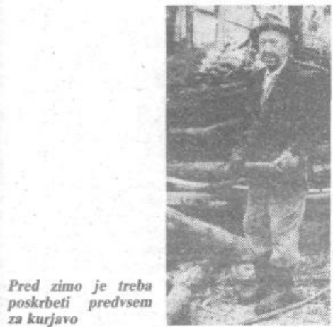
Pred zimo je treba poskrbeti predvsem za kurjavo