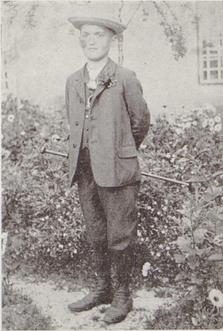
Birmanec (12 let)