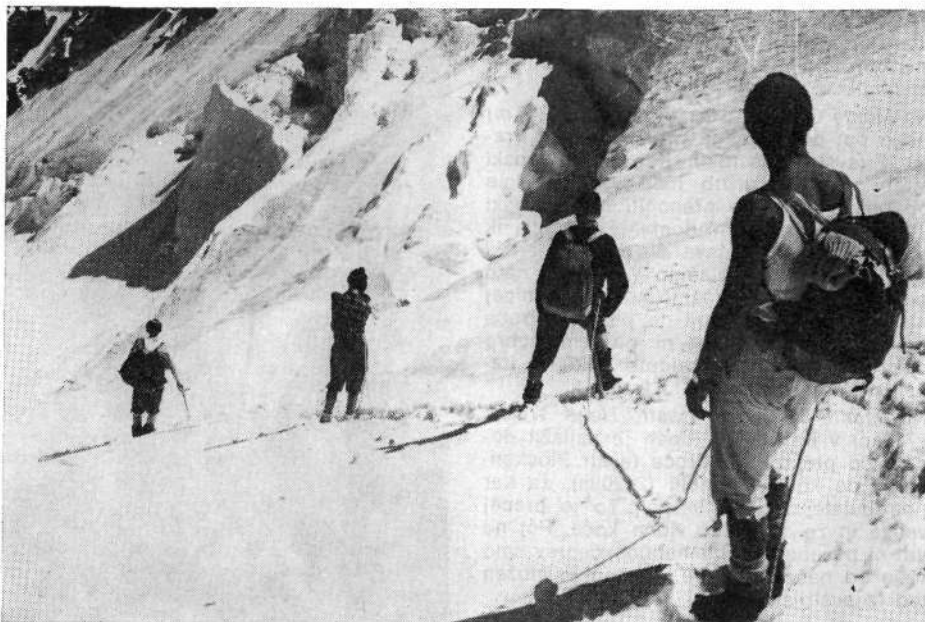
Vračanje z Grossglocknerja po ledeniku Pasterze