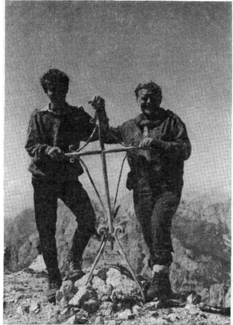
Avtor prispevka s sinom na vrhu Monte Peralba (2694 m)

Na Viš (ital. Jof Fuart , nemško Wischberg , 2666 m) pelje pot od prelaza Sella Nevea do kočice Corsi po lepi poti. Imel sem srečo: v koči sem se seznanil z Rezijancom in skupaj sva se povzpela na Viš po težki, vendar dobro zavarovani poti prek Gamsove matere in Divje kože. Nepozabno! V lepem vremenu mi je ostala za spomin serija diapozitivov. — Na Montaž (ital. Jof di Montasio , 2753 m) sem se s planinskimi prijatelji pred leti povzpela po dobro zavarovani, vendar nevarni in ponekod navpični » Poti italijanskih lovcev « (ital. » Via dei Cacciatori Italiani «). Pot imenujejo tudi » Via Amalia «. Ker je pot