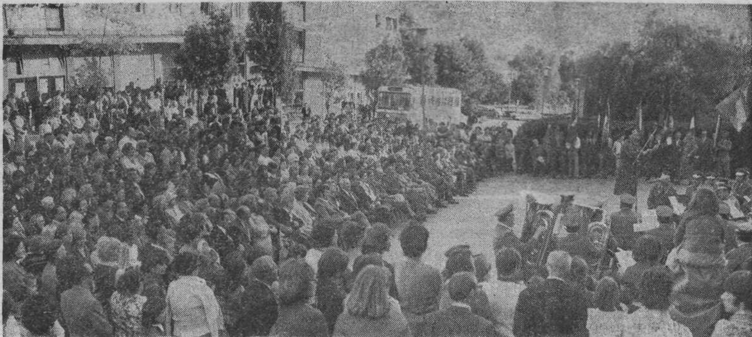
M. J. Tudi krajanji in gostje so s svojo množično prisotnostjo dali organizatorjem proslave priznanje za odlično pripravljeno prireditev

Po kvalitetnem in scensko odlično izpeljanem programu so se krajanji in gostje, na tovariškem srečanju, v katerem so za dobro organizacijo in strežbo poskrbeli mladinci in pripadniki JLA, še dolgo zadržali v prijetnem pomenku.