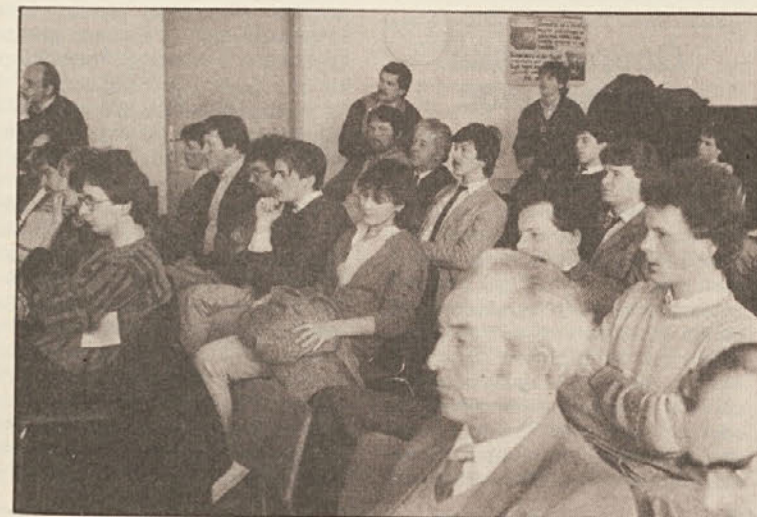
Mladina je na občnem zboru bila številno zastopana.

Mladina je načela problem sosvetov in ugotovila, da bi vstop v sosvete ne pomenil