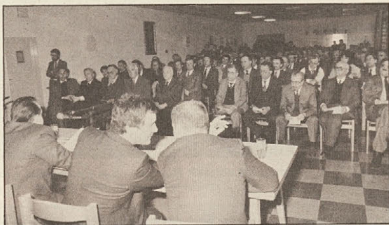
Dvorana Slomškovega doma je bila polna, delegati in člani NSKS so prišli iz vseh krajev našega ozemlja.