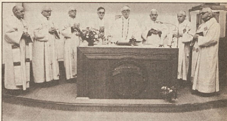
Višek kvartnega sestanka, v četrtek, 20. februarja 1986 v Domu v Tinjah je bilo slovesno somaševanje osmih letošnjih zlatomašnikov. Slovenski duhovniki so prvič v svojo sredo povabili tudi praznujoče nemško govoreče sobrate.