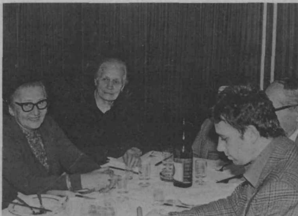
Pred dnevom republike so se starejši občani KS Bežigrad zbrali v Bežigraskem hramu; bojne so predstavniki krajevne skupnosti obiskali na domu.