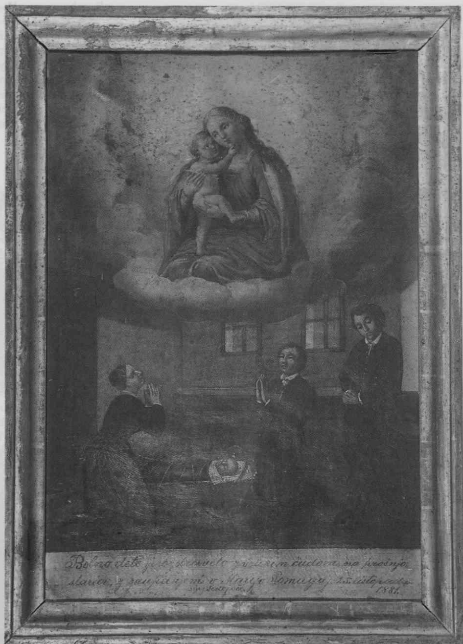
Votivna podoba z letnico 1881, Zahvala za ozdravitev bolnega otroka k Mariji Pomagaj z Brezij (Brežje, Samostan)