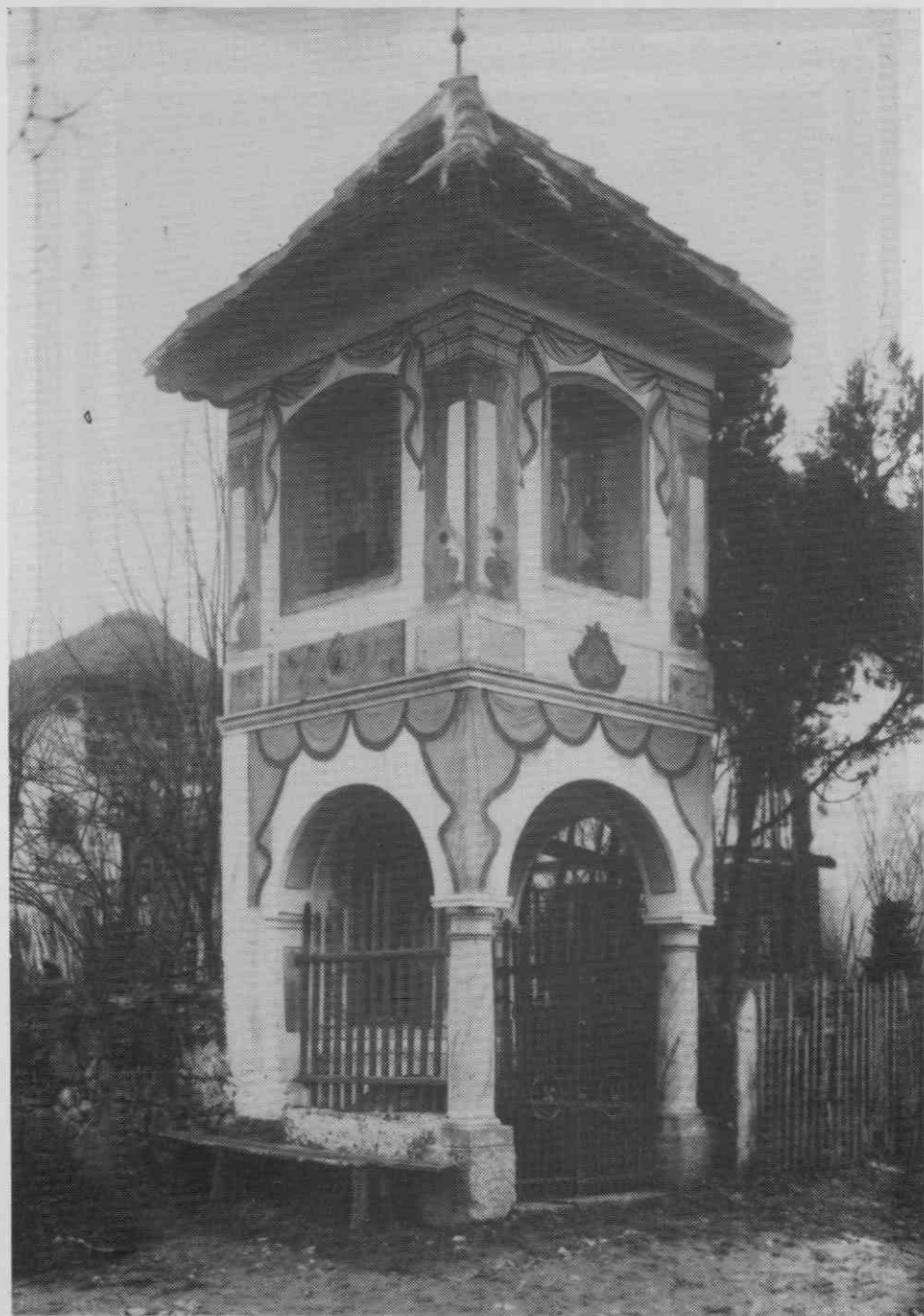
Kapelica, 19. stoletja, Biška vas pri Mirni peči