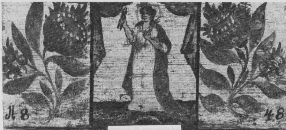
Panjska končnica z letnico 1848, Sv. Aponolija (SEM inv. št. 2451)

če zopet ozdravim..." (Kaminski, str. 173—175) ali konec 19. stoletja: „V nedeljo bo oni veliki shod pri sv. Luciji na Skaručini, in če Rezi malo odleže, pojdeva tja: saj je sveta Lucija pomočnica za oči" (Kersnik, str. 61).