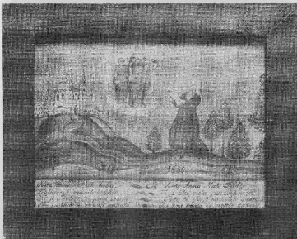
Votivna podoba z letnico 1850, Mati z dojenčkom se zahvaljuje Materi božji