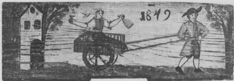
Panjska končnica z letnico 1849, Mož pelje pijano ženo na vozičku, Gorenjsko (SEM inv. št. 1027)

Naj še omenimo, da so po zgledu staršev, po vsej verjetnosti le staršev alkoholikov, pili tudi otroci. O tem je največ podatkov za Dolenjsko (npr. Trdina, str. 534, 569, 581). Med njimi so znani tudi podobni, skoraj neverjetni: „Otrok pri nas na eno plat ust sesa, na drugo pa mu mati vliva vino v grlo. Oddojen dobiva mesto vode vino“ (Trdina I, str. 261). Če lahko verjamemo podatku, ki pa ga nikakor ne kaže posploševati, je nekoliko večji otrok, če se je primerilo, da mu starši niso dali vina, tudi sam prišel ponj v gostilno (Trdina I, str. 53).