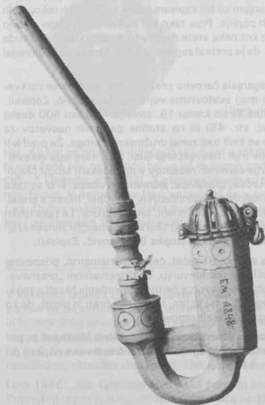
Lesena pipa, 19. stoletje, Gorenjsko (SEM, inv. št. 1848)

Kar zadeva skrb za zdravje, so poučni podobni podatki, ki pričajo o tem, da so v agrarnem okolju na splošno malo ali nič skrbeli za svoje zdravje. Vse kaže, da so, če so se na primer pri težaškem in napornem delu pregreli, ravnali prav nasprotno, kot bi bilo dobro (npr. Lendovšek, str. 96). To je bilo v skladu s prepričanjem, da „mi nismo mehki kot gospoda, nam nobena reč ne škoduje“. Prav zaradi takšnega prepričanja pa „jih gre“, kot zatrjuje člankar leta 1853, „morebiti polovica iz same malomarnosti pred časom v zemljo“ (Levičnik, str. 339, 400).