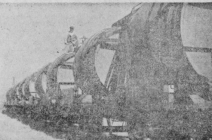
Trgovsko podjetje »Slovenske Go rice« ima za dobave po Jugoslaviji in za izvoz 10 novih vagonov kih cistern po 7.500 litrov, ki so montirane na 5 železniških vagonih. Sode je izdelalo Sodarstvo Maribor, vagon pa Podjetje za popravilo voz JZ Ptuj. S tem bo podjetje prihranilo devize, ki jih je moralo sedaj odstopati inozemskim prevoznim firmam ob izvozu okrog 190 vagonov izvoznega viza.

Z ukazom predsednika republike je bil dosedanji načelnik oddelka za tisk in informacije v državnem tajništvu za zunanje zadeve Jakša Petrič imenovan za veleposlanika v ČSR.