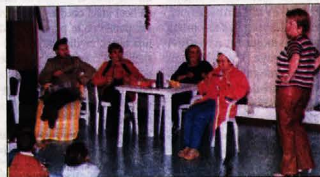
Kulturna manifestacija za praznik žen

17. maja so bile v Italiji volitve. Zmagala je desna sredina. V obmejnem pasu dezele se je lepo uveljavila