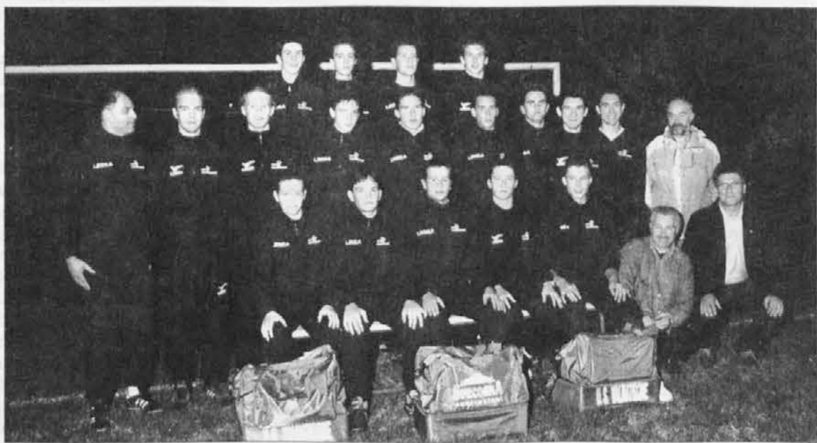
La squadra di Baulini al gran completo

di gara per un atterramento in area di Duriavig.