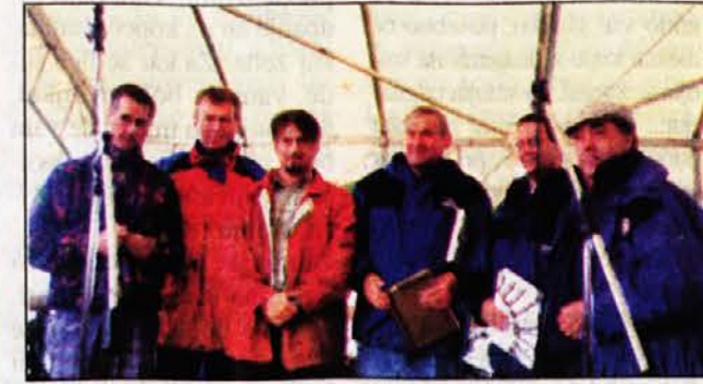
30. srečanje planincev na Matajurju

“Proti diskriminaciji” je bila parola množične manifestacije pred deželo v