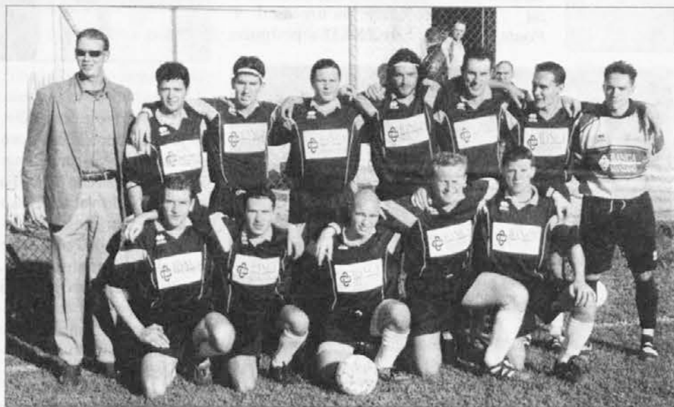
La Savognese ha ripreso quota

Per poter giocare questa partita di recupero, programmata a Savogna, le due società si sono accordate per l'inversione di campo a causa del ghiaccio che ha reso impraticabile il rettangolo di gioco