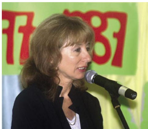
generalna direktorica direktorata za osnovne šole gospa Mojca Škrinjar