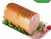
SAL.PIZZA 1kg MERC. 4,13 EUR/kg