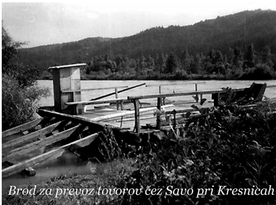
Brod za prevoz tovorov čez Savo pri Kresnicah

Brod je vodno plovilo za prevoz potnikov in vozil čez vodo. Rečni brod je trdno pritrjen na jekleno vrv s škripcem, ki teče po vrvi, napeti čez reko. Za premikanje brod izkorišča vodni tok reke, preko smernega krmila.