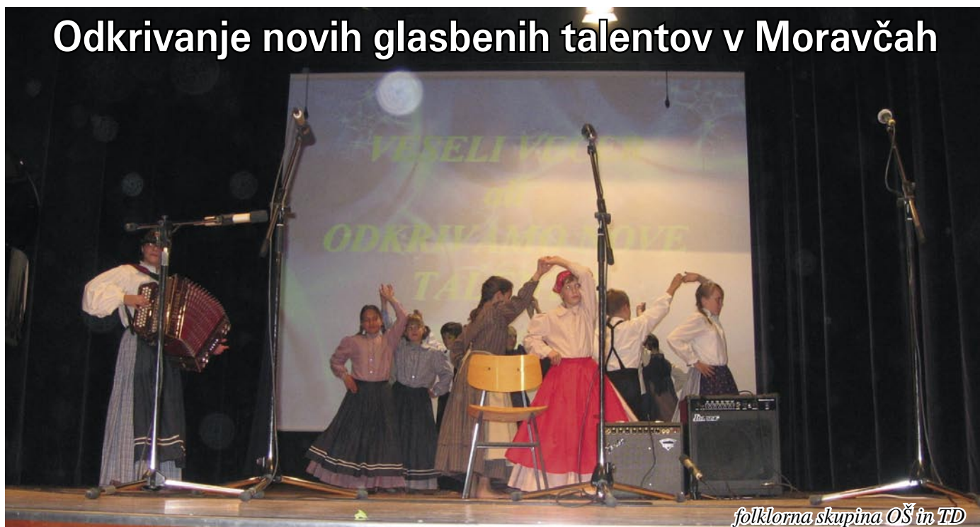
folklorna skupina OŠ in TD

Naše glasbene talente pohvalijo vsi, ki jih imajo priložnost slišati. Dvorano Kulturnega doma v Moravčah pohvali vsako kulturno društvo, ki gostuje na našem odru. Priložnost se kar sama ponuja in Programski svet je predlagal, da Občina pripravi zabavno prireditev, na kateri bi se predstavili novi glasbeni talenti.