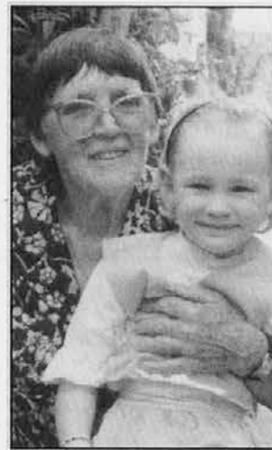
Slavljenska z eno od vnukinj

Voščil, cvetja in daril je bilo res veliko. Zato se prek vašega časopisa želim zahvaliti prav vsem. Najprej gospodu žup-