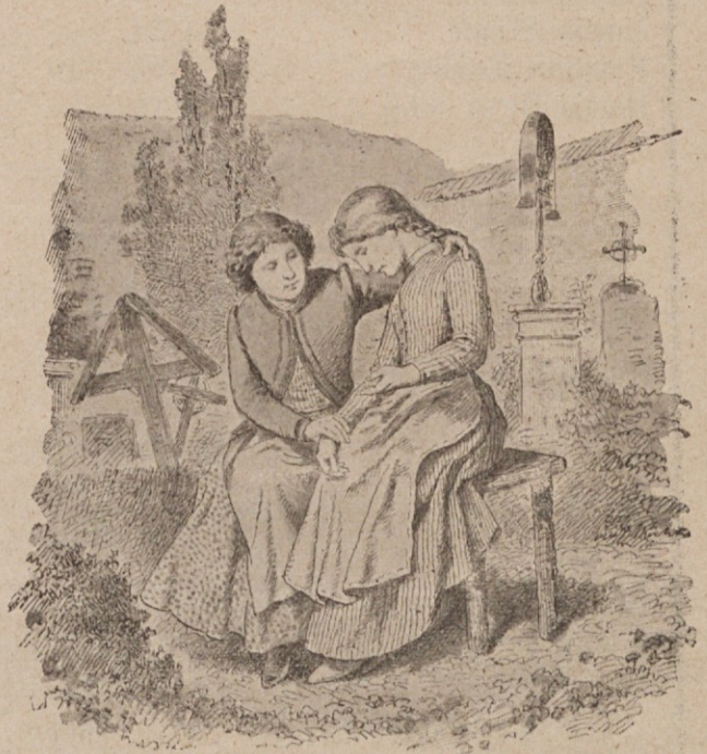
Na materinem grobu.

Res hvaležen mora biti slovenski narod ljubljanskemu škofu, ki nam je ustvaril to slovensko kulturno ognjišče in vir prave omike. Razni ljudje so razvpili našega škofa po časopisih kot sovražnika vede in umetnosti; ti zavodi so nam priča in dokaz, da to ni res. Naš prevzvišeni knez in škof nam je začrtal pot, po kateri naj hodimo drugi. On nam je vzor, on nam je vzgled, da se da tudi preko takih ljudi, ki ne poznajo drugega kot kričanje in — sebe kaj storiti za svoje ljudstvo