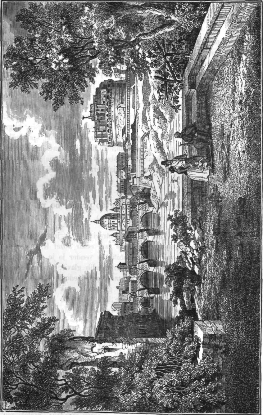
Angeljski grad in cerkev sv. Petra v Rimu.

je bil Lateran stolni grad papežev, pozneje pa Kvirinal navadno stanovališče papežev vladarjev.