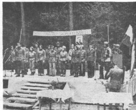
»Tovariši, naša skupina vam bo zaigrala PARTIZANSKI MITING!«

Po končanem mitingu so se mladi zavrteli v kolo in njihova pesem je odmevala tja do vrha Rožnika. Nasploh je bilo vzdušje in celotna prireditev na visoki ravni, za kar je nedvomno pripomogel tudi partizanski golaž in Vojaški ansambel kasarne Ljubo Sercer. Člani osnovne organizacije ZSMS Zgornja Šiška pa so nam pripravili pester srečolov, pa tudi če-vapčice ali kotlete je človek po polurnem čakanju lahko dobil. Bilo je pač mnogo lačnih ust in mnogo družin je zadnjo nedeljo v mesecu mladosti preživelo v Mostecu — lep vikend.