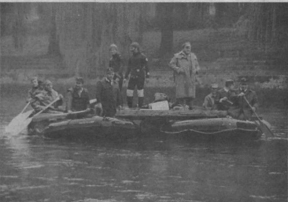
Reševalna ekipa na improviziranem splavu na licu mesta