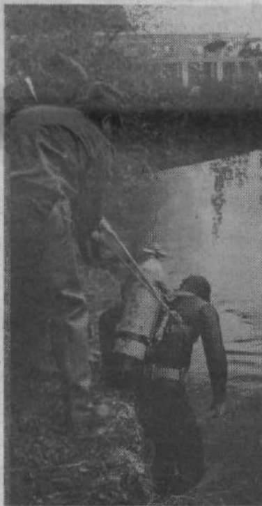
Tok reke je bil izredno močan, tako da so za varnost potapljačev poskrbele vrvi v zanesljivih rokah pripadnikov CZ