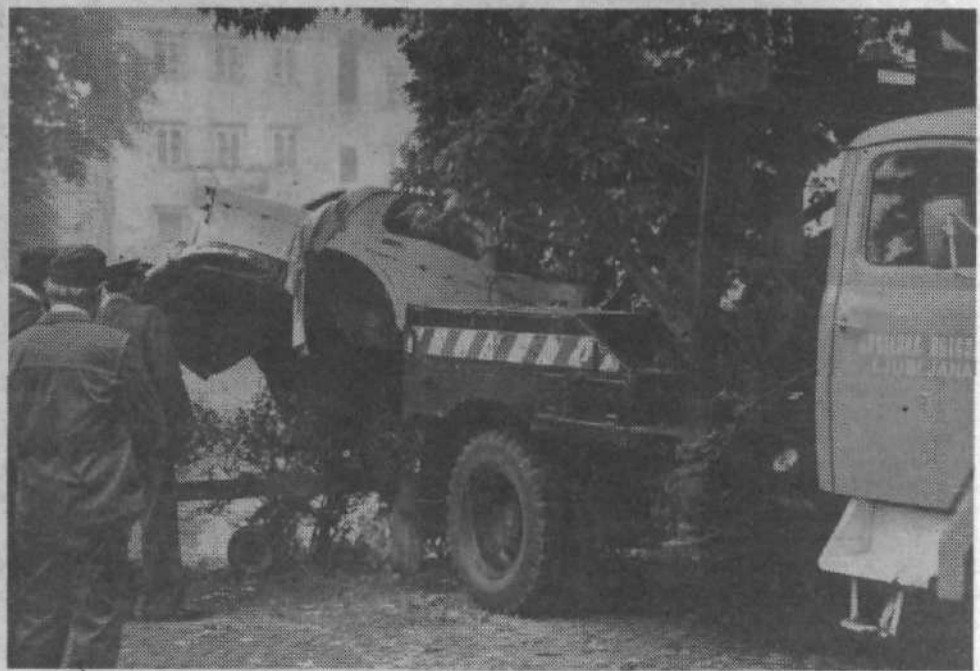
... nato še čez ograjo in skelja reševanja je bila uspešno zaključena.