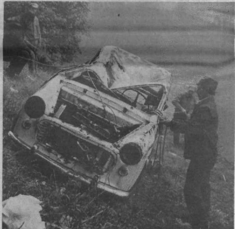
Avtomobil je na bregu...