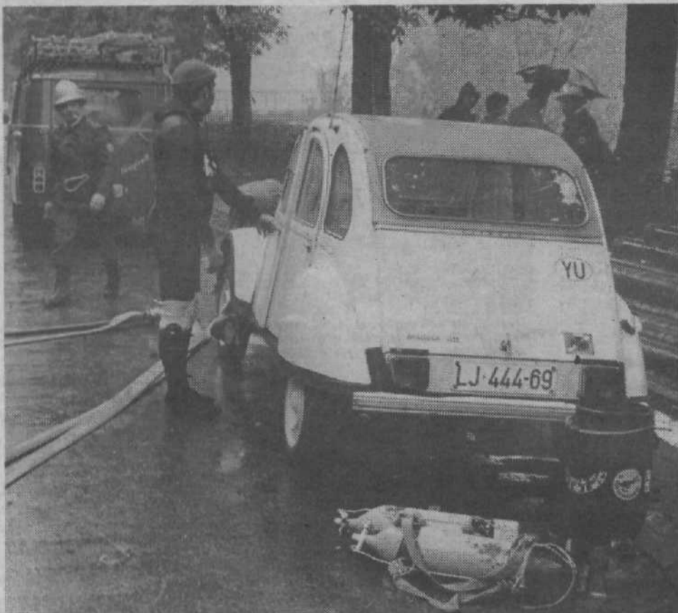
Gasilci, ljudje-žabe in drugi so bili tako rekoč v hipu na bregu Ljubljanice