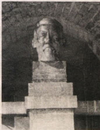
Plečnikov spomenik v Križankah