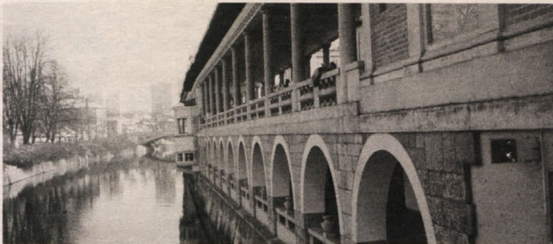
Tržnice z rečne strani