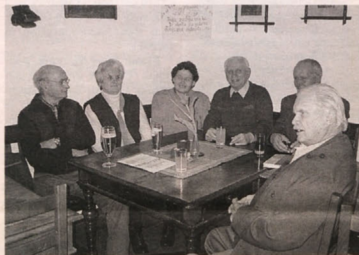
Veliko so imeli povedati