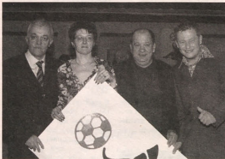
SAK – ples združuje ...