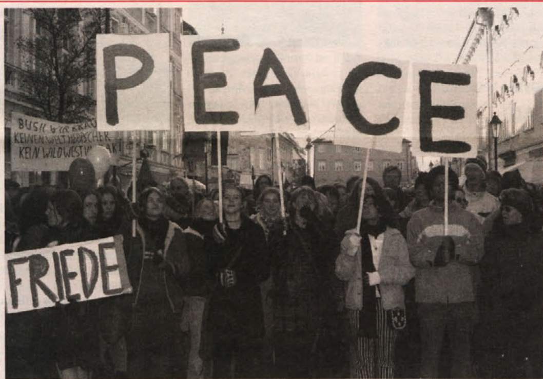
Pretekli konec tedna je milijone ljudi po vsem svetu demonstriralo za mirno rešitev iraškega problema. Tudi v Celovcu se je pretekli petek zbralo nad tisoč ljudi, med njimi veliko mladih, ki so s transparenti v rokah odklonili vojno proti Iraku.