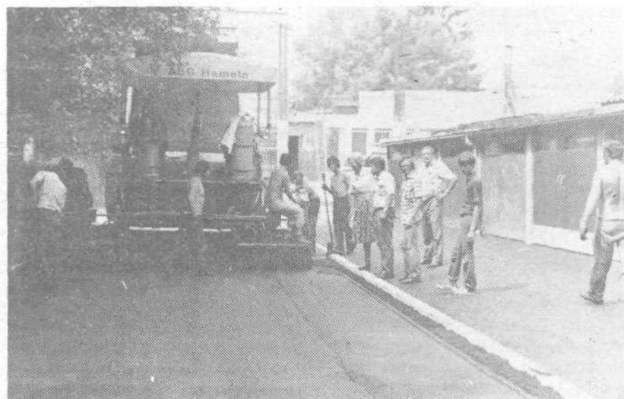
Asfaltiranje dovozne poti