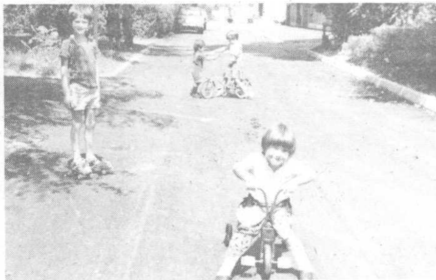
Urejeno okolje – veselje otrok in odraslih na Postojnski 21, 23 (Vsi podatki Katja Tomazič)