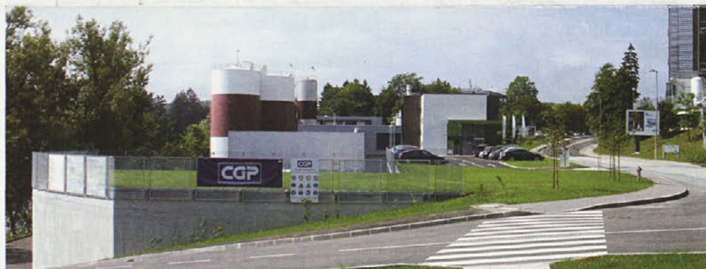
Nova čistilna naprava v vgrajeno sodobno membreansko tehnologijo, ki jo druge uporabljajo pri obdelavi pitne vode za vodoskrbo