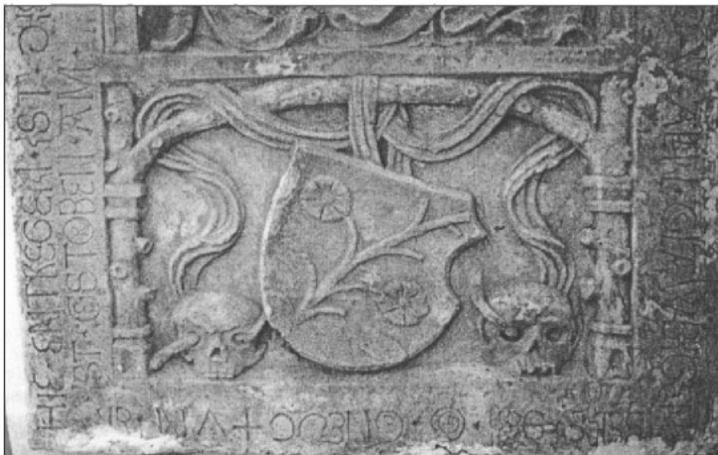
Grb na nagrobniku v župni cerkvi sv. Jurija v Stari Loki.