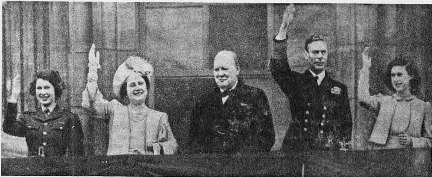
Fokojni Winston Churchill 8. maja 1945 — ko se je vdala Nemčija — v buckinghamški palači, skupaj s pokojnim kraljem Jurijem VI. in kraljico. Na skrajni levi je sedanja kraljica Elizabeta, na skrajni desni pa njena sestra pincesa Margaret

Kakor da bi hotel še pred smrtjo pokazati vso svojo odpornost in borbenost, ki je bila za Winstona Churchilla tako značilna v njegovem življenju, je ta izredni človek kljuboval v neenakem boju tudi smrti polnih deset dni. Nato je položil orožje pred njo tudi on. V nedeljo 24. januarja ob 9. uri mu je zastalo srce.