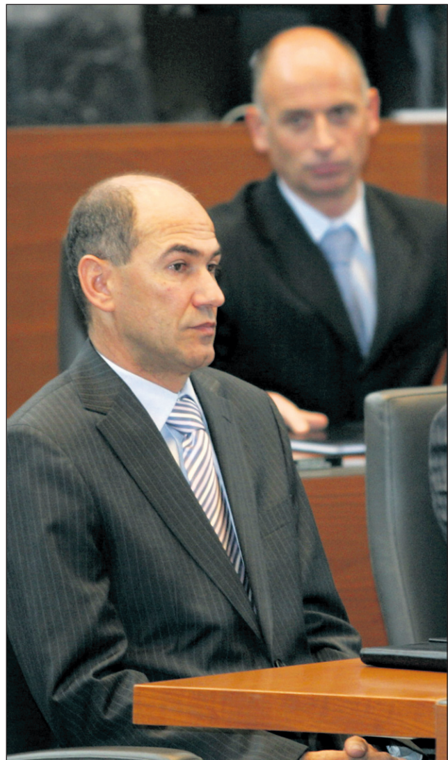
Minister Janez Drobnič je bil na zahtevo premiera Janeza Janše in po glasovanju v DZ razrešen.

Bilo je sicer jasno, da se bo zgodilo in da je ministroma odstavitev bila le vprašanje ur oziroma dni. V petek je glasovanje poslancev pokazalo, da Janez Drobnič nima več kaj iskati na mestu vodilnega moža ministrstva za delo, družino in socialne zadeve. 59 poslancev je namreč glasovalo za njegovo razrešitev, le sedem jih je bilo proti, šest od prisotnih pa se je glasovanja vzdržalo.