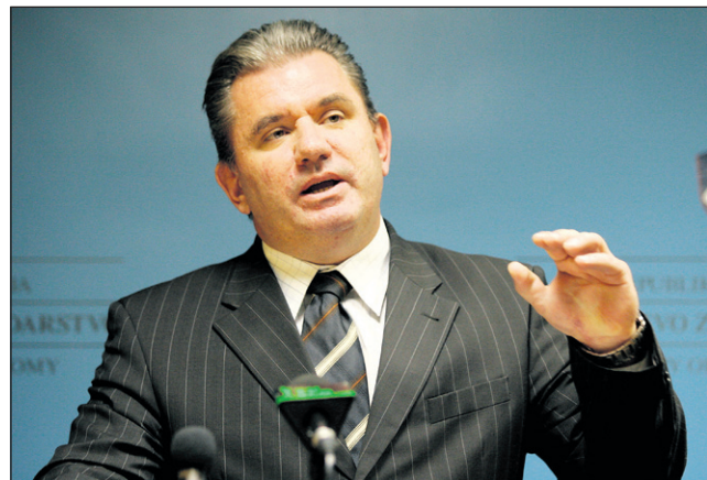
Začasno (največ do treh mesecev) bo socialno ministrstvo vodil gospodarski minister Andrej Vizjak.

veka za to funkcijo v svojih vrstah, kot kaže, nima. Razlogov, zakaj je Drobnič odletel s položaja ministra, je več; v prvi vrsti naj bi bilo po besedah Janeza Janše nezadovoljivo vodenje resorja, ustvarjanje nepotrebnih konfliktov pri vodenju socialnega dialoga ter poseganje v pristojnosti drugih resorjev. Na ministrstvu je že nekaj časa prihajalo tudi do neusklajenega delovanja, z Drobničevim delovanjem pa ne bi bilo možno dokončati nekaterih pomembnih reformnih ukrepov, ki jih je treba sprejeti v najkrajšem času, je zahteval po razrešitvi Janeza Drobničevega argumentiral premier. Jasno, da je Drobnič vse naštetu zanikal, pa tudi tisti, ki so ostali na „njegovih“ strani so mnenja, da je svoje delo opravljal dobro in točno po smernicah in zapovedih vlade oziroma premierja. Zanimivo v tem boju je stališče LDS, ki ji je razrešitev ministra prišla čisto prav (in jo je tudi večinoma podprla), vendar pa preko tega miniranja kaže s prstom tudi na Janšo, češ da je bil Drobnič le aparat za