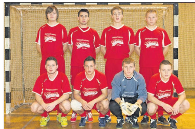
Ekipa Bar Cheers Cyber cafe