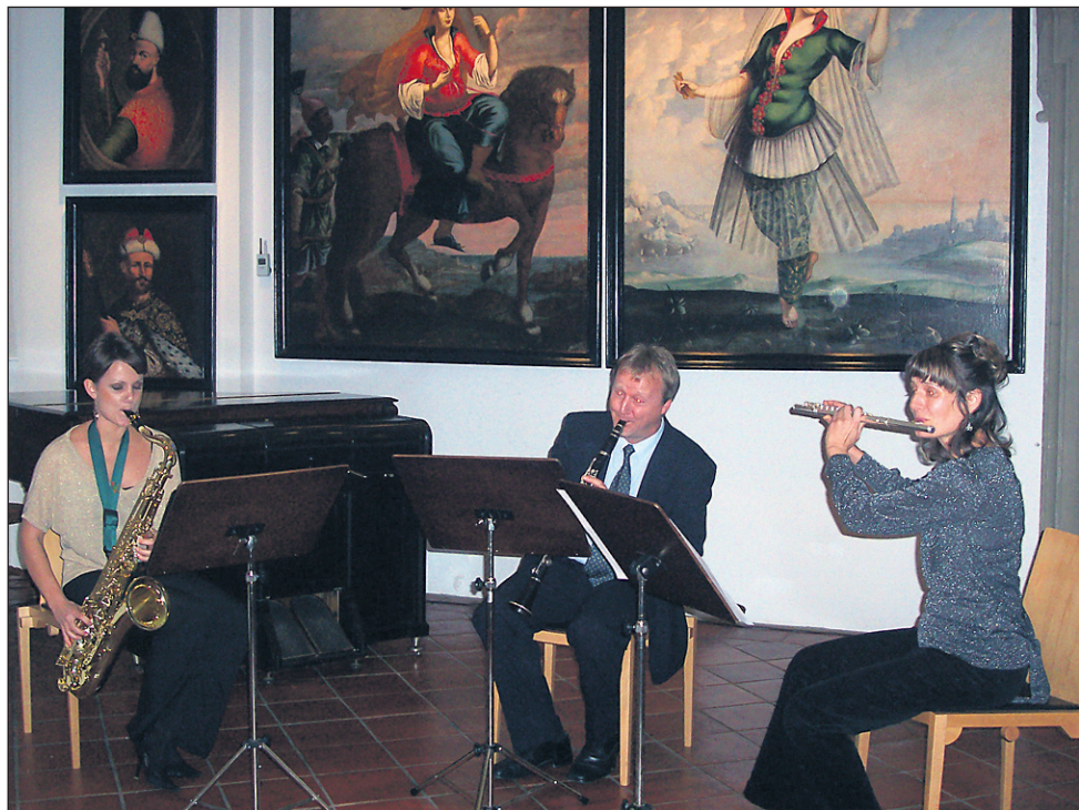
Prireditve so zaključili, kot se spodobi, z glasbo.