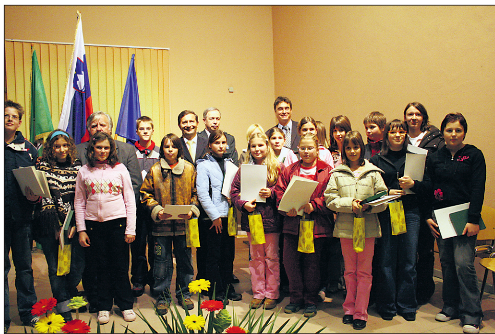
Nagrajenci skupaj z ministroma, generalom in predsednikom strokovne žirije.

Po slovesnosti na Zavrhu pa je isti večer še potekal ustanovni občni zbor društva generala Rudolfa Maistra Lenart. Na njem so sprejeli dru-