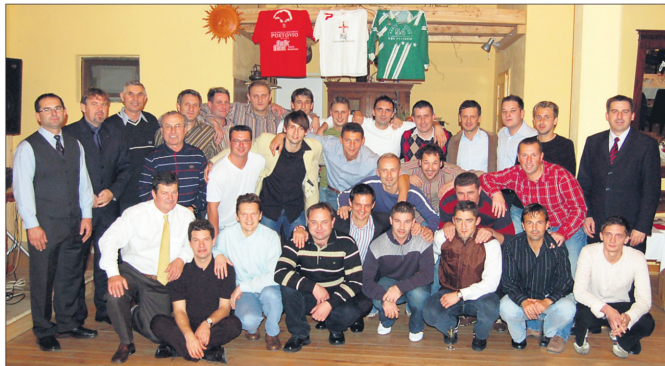
Skupinski posnetek udeležencev praznovanja 20-letnice KMN Poetovio Ptuj