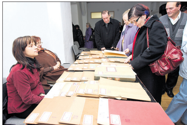
Notno gradivo, ki so ga odkrili na podstrešju Narodnega doma so lahko pevski zbori in pevske skupine odnesle brezplačno.