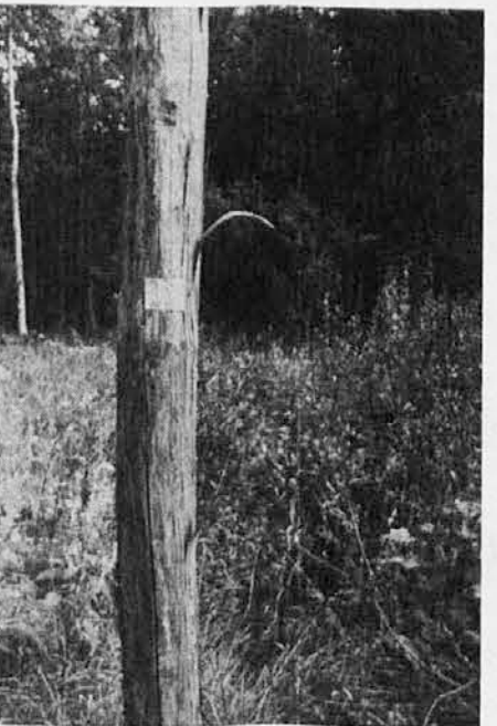
Telefonski drog št. 122: nema priča v Kočevskem Rogu pomorjenih

Po nalogi vlade je posebna komisija obiskala to področje; ugotovili so, da so tam trije veliki podzemski objekti skopani v kraški svet. Eden teh objektov je bil določen za zatočišče slovenskega partijskega vrha, če bi to bilo kdaj potrebno. Vanj se pride skozi zamaskiran vhod. Notri so bolnišnica, spalnice, sejna soba, pisarne, kuhinja. Vsi prostori so centralno ogrevani, zato suhi, električno razsvetljeni.