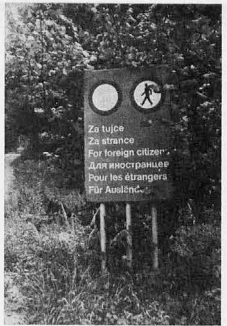
Tabla v Kočevskem Rogu z opozorilom: Za tučce prepovedano!

Temu protestu se je pridružila še SKGZ iz zamejstva in s svojo izjavo podprla s