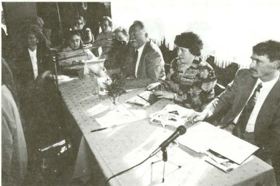
Občni zbor Društva za boj proti sladkorni bolezni