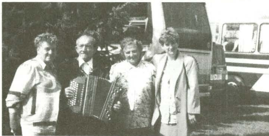
Z Jožeta na izletu