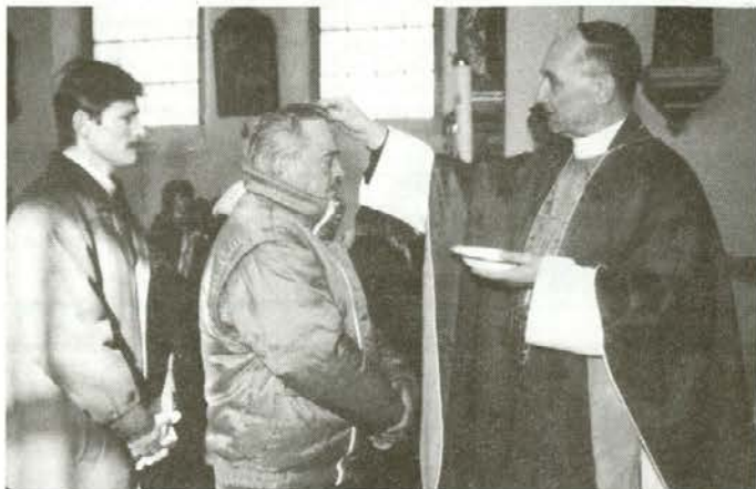
Mariborski škof dr. Franc Kramberger med pepeljenjem v cerkvi sv. Florijana v Doliču

Na podlagi mnenja Ministrstva za informiranje z dne 30. 1. 1992 je VIHARNIK proizvod informativnega značaja iz 13. točke tarifne številke 3, za kar se plačuje petodstorni davek od prometa proizvodov.