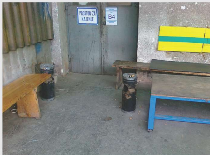
Na sliki je prikazano dopolnjeno označevanje kadihnic.

Po trenutno veljavni zakonodaji glede omejevanja uporabe tobačnih izdelkov je v podjetju od sredine leta 2007 prepovedano kajenje v vseh zaprtih delovnih prostorih (zaprt delovni prostor je prostor, ki ima streho in popolnoma zaprto več kot polovico površine pripadajočih sten). Kajenje je dovoljeno le v kadihnicah izven objektov. Po novem je kadihnic več, hkrati pa so še dodatno označene. Poleg table "prostor za kajenje" je tudi dodatna tabla z navedbo stroškovnega mesta. Delavci iz navedenega stroškovnega mesta skrbijo za čistočo kadihnic. V primeru, da se bo ob kontrolnih pregledih ugotovilo, da kadihnica ni urejena in čista, se bo ta kadihnica ukinila. Sprememba zakonodaje v začetku tega leta je poostrila kazni glede kajenja na prepovedanih mestih.