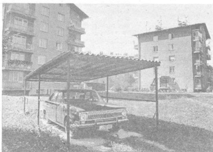
V Zavetniški ulici je neki stanovalec takole sredi zelenice zavaroval svojega konjička