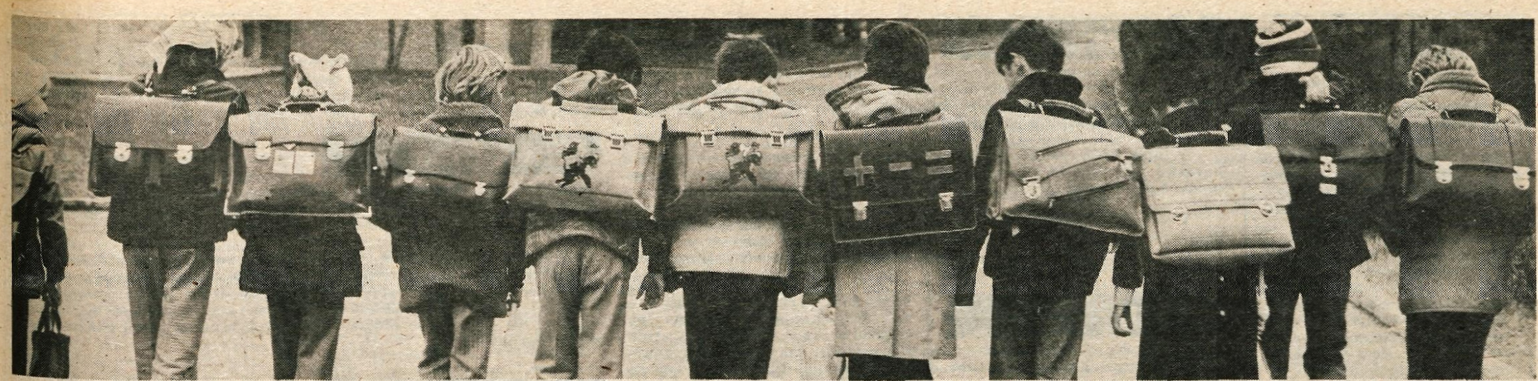
Kar dobro jo stopimo — do doma je še daleč in torbe so težke.