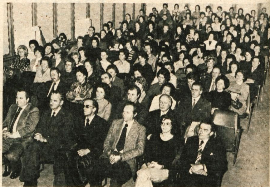
Delavci TOZD Preskrba in gostje na ponedeljkovi prireditvi ob 25. obletnici Mercatorja

Besedilo: J. Košnjek