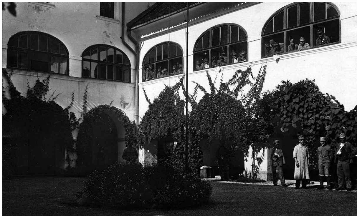
Okrevajoči ranjeni vojaki v atriju mekinjskega samostana v času prve svetovne vojne.

Češko bolniško osebje se je 13. julija 1916 preselilo v Brežice, 73 še prej pa se je konec junija del bolnišnice iz samostana in mežnarije preselil v Prašnikarjevo cementno ter opekarsko tovarno v spodnjem delu Mekinj, tik ob reki Kamniški Bistrici. 74 Ob odhodu Čehov je mekinjski župnik v kroniki potegnil bilanco »češkega obdobja« v Mekinjah. Njegove ugotovitve se v veliki meri skladajo s prej omenjenimi ugotovitvami ene od mekinjskih uršulink, da je »bolnica v materialnem oziru prinesla precej denarja v kraj, saj je za izdatke v enem letu porabila čez milijon kron«; 75 v času bivanja so odkupili in porabili 150 glav goveje živine, njihovi »trenarji« pa so s konji obdelovali polja in njive ne samo v kraju, ampak tudi v okolici, vse do Tuhinjske doline. 76 Po drugi strani pa je »v moralnem oziru bolniško osebje škodovalo prebivalcem, predvsem ženskemu spolu«, pri čemer je župnik izpostavil preveč liberalen odnos Čehov in drugih vojakov do spolnosti in kontracepcije, saj so se nekateri vojaki zapletli v ljubezenske odnose z domačinkami. 77 Tako je župnik ugotavljal, da »so se celo nekatere zakonske žene preveč