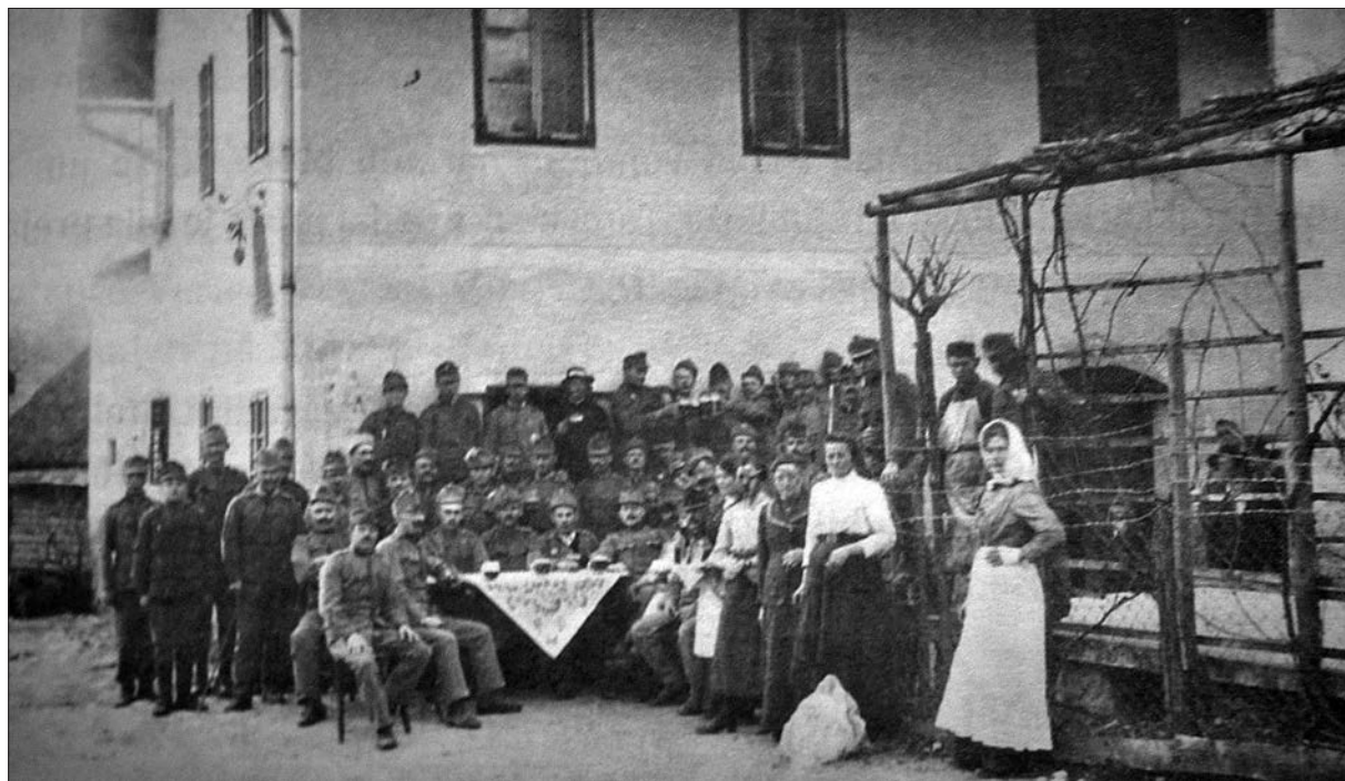
Vojaki v času prve svetovne vojne pred »Plevelovo« gostilno v Mekinjah.

tako so pri tedanjem mekinjskem županu Gamsu (po domače Špornu) ukradli 40 klobas. 102