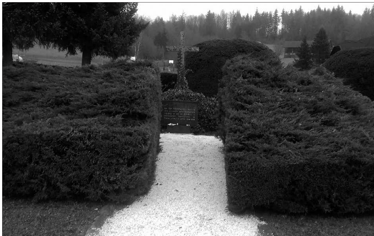
Vojaško pokopališče v Mekinjah, na katerem je pokopanih 109 vojakov, danes.