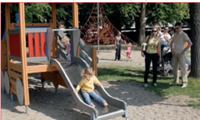
Otroci med igro.