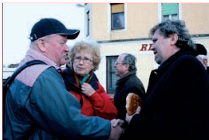
Županu so Polzeljani prinesli darilo – kruh v obliki polne lune in monografijo o Polzeli.

Da ne bi pozabili lepega druženja, smo pohodniki že na naslednjem pohodu v Ljudskem vrtu, kjer se zbiramo že vrsto let, posadili še simbolično drevo – ginka. Zelo staro drevo, ki je okras našega parka, že počasi usiha, zato smo posadili novega, da bi ostali spomini na naša druženja in da bi nova, mlada drevesa krasila našo okolico. Ob dnevu zemlje, ob dnevu knjige in drugih aprilskih jubilejih se nam