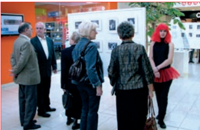
Razstava fotografij iz lastnih arhivov nekdanjih plesalcev.

Zavestna namera organizatorjev ali zgolj slučajnost? Presodite sami.