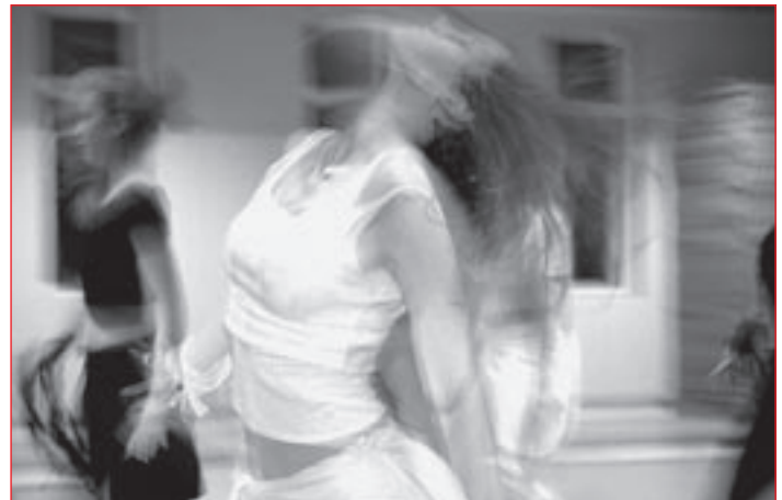
Plesna predstava Biti, 2006.

Pri praznovanju dneva plesa ne gre zgolj za balet ali sodobno plesno ustvarjanje, ampak za vse zvrsti plesne dejavnosti, ki človeštvo spremljajo od pradednine. Ples ima pomembno socialno, socializacijsko in