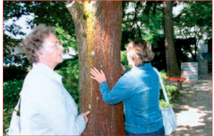
Člani Medobčinskega društva slepih in slabovidnih med sprehodom po učni poti.

Učna pot za slepe in slabovidne osebe je skupen nacionalni projekt, ki je prvi in trenutno edini tovrsten objekt na celotnem območju Slovenije. Učna pot v parku vrtnarske šole pomaga slepim in slabovidnim osebami na področju izobraževanja in usposabljanja – pot je opremlje-