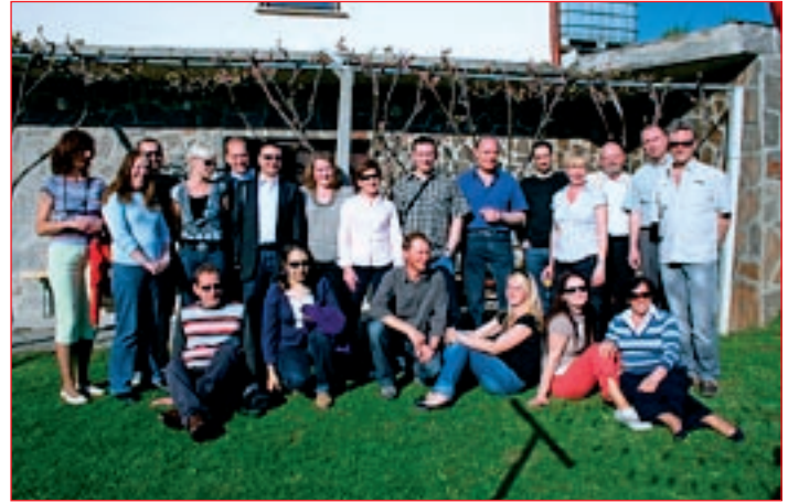
Udeleženci študijskega obiska na Ljudski univerzi Ptuj.

Program študijskega obiska je bil razdeljen v tri enakovredne sklope: teoretičnega, ki je za-