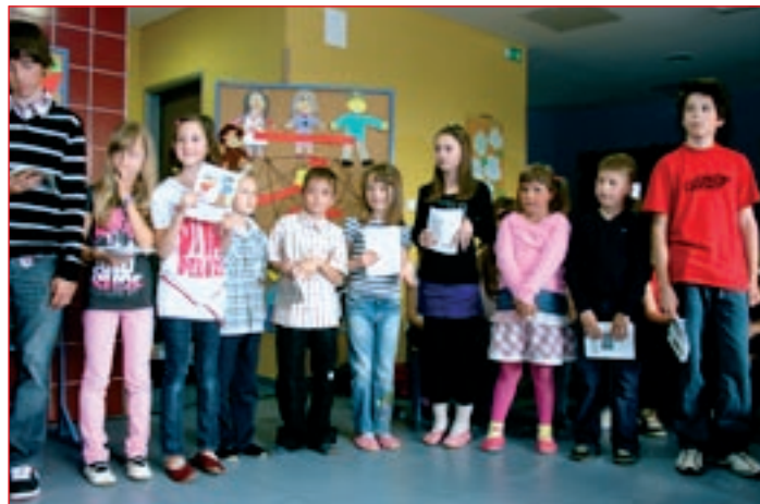
Učenci med branjem svojih prispevkov.