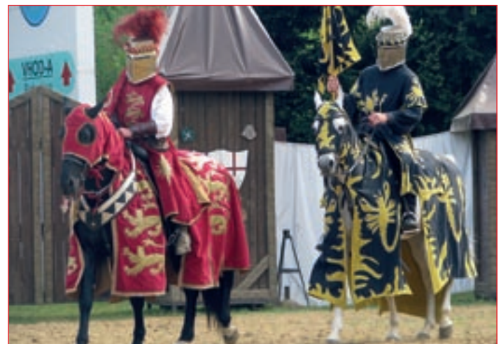
Vitezi so obiskali najstarejše slovensko mesto.