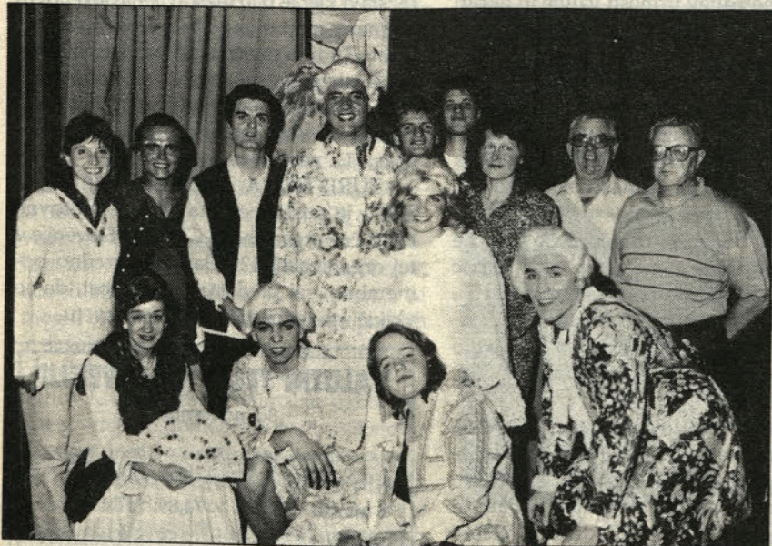
Igralci, režiser, scenografa in pomočniki.