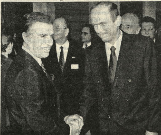
Predsednik Argentine C. Menem in predsednik slovenske vlade J. Drnovšek v Maastrichtu.